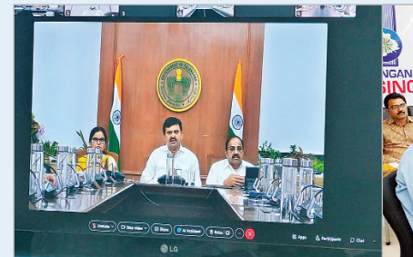
ఆదిలాబాద్, జనవరి 18 (ప్రభాత సమాచారం)