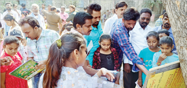
ఆదిలాబాద్, జనవరి 18 (ప్రభాత సమాచారం)

జవహర్ లాల్ నవోదయ విద్యాలయంలో 6వ తరగతిలో ప్రవేశం కోసం శనివారం జిల్లాలో నిర్వహించిన ప్రవేశ పరీక్ష ప్రశాంతంగా జరిగింది. జిల్లా వ్యాప్తంగా 1170 మంది విద్యార్థుల కోసం ఆదిలాబాద్ పట్టణంలో 3, ఉట్నూర్, ఇవ్వడలో ఒకటి చొప్పున మొత్తం 5 కేంద్రాలను ఏర్పాటు చేశారు. ఉదయం 11.30 నుంచి పరీక్ష ప్రారంభం కాగా గంట ముందుగానే విద్యార్థులను కేంద్రాల్లోకి అనుమతించారు. హాల్ టికెట్ తో పాటు ఆధార్ గుర్తింపు కార్డును పరిశీలిస్తూ లోనికి పంపించారు. చుట్టు పక్కల ప్రాంతాల నుంచి తరలివచ్చిన విద్యార్థులు, వారి తల్లిదండ్రులతో కేంద్రాలు సందడిగా మారాయి. మధ్యాహ్నం 1.30 లకు పరీక్ష పూర్తయి 1170 మంది విద్యార్థులకు గాను.. 962 మంది హాజరయ్యారు. 208 మంది విద్యార్థులు గైర్జాబరయ్యారు. పరీక్షా కేంద్రాల వద్ద విద్యార్థులకు ఎలాంటి ఇబ్బందులు తలెత్తకుండా ఏర్పాట్లు చేశారు. డీఈవో ప్రణీత కేంద్రాలను సందర్శించి పరీక్షను పర్యవేక్షించారు.