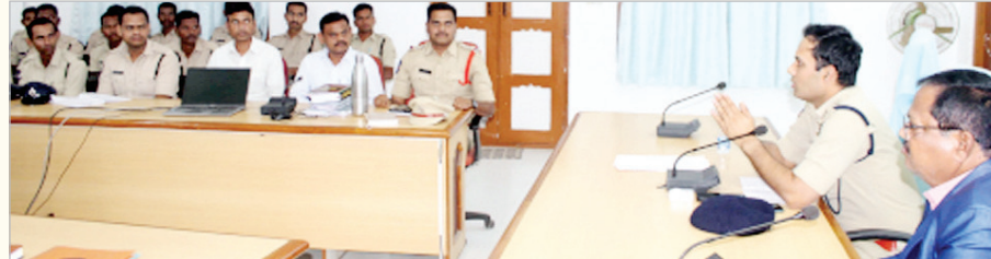
ఆదిలాబాద్ జిల్లా ఎస్పీ గౌడ్ ఆలం

స్టేషన్లు వచ్చి ఫిర్యాదు దారుల పట్ల న్యాయంతో వ్యవహరిస్తూ తక్షణమే సిబ్బందిని కేటాయించి సమస్యను పరిష్కరించే దిశగా కృషి చేయాలని సూచించారు. ముఖ్యంగా సమాజంలో బీదస్థుల పట్ల, వెనుకబడిన తరగతులు వారి పట్ల, అధివాసుల పట్ల గౌరవంగా వ్యవహరిస్తూ న్యాయం చేకూర్చే విధంగా చర్యలను తీసుకొని ప్రజలకు పోలీసుల పట్ల ఉన్న గౌరవాన్ని కీర్తిని పెంపొందించే దిశగా కృషి చేయాలని సూచించారు. న్యాయం ప్రతి ఒక్కరికి సమానమే అనే అంశాన్ని ప్రతి ఒక్కరూ మనసులో ఉంచుకుని విధులను నిర్వహించాలని సూచించారు. అదేవిధంగా పోలీసు విధులను కమ్యూనికేషన్ వ్యవస్థ కీలకమైనది వాటిని ఉపయోగించే విధానాన్ని నేర్చుకొని అమలుపరచాలని