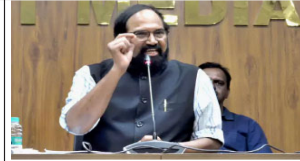
ధాన్యం కొనుగోళ్లపై మంత్రి ఉత్తమకుమార్ రెడ్డి సమీక్ష