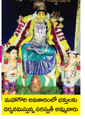
మహాగౌరి అవతారంలో భక్తులకు దర్శనమిస్తున్న సరస్వతీ అమ్మవారు