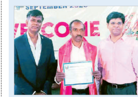
రాష్ట్ర స్థాయి ఇన్నోవేటివ్ టీచర్ అవార్డుకు మోడల్