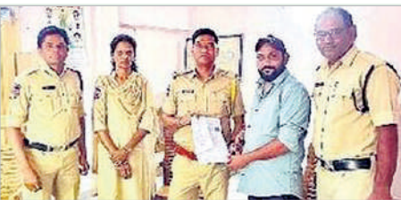
ఆదిలాబాద్, సెప్టెంబర్ 29 (ప్రభాత సమాచారం) మద్యం షాపుల టెండర్లకు సోమవారం బోటీ అయ్యింది. ఈనెల 26న ప్రక్రియ ప్రారంభం కాగా ఆదివారం వరకు