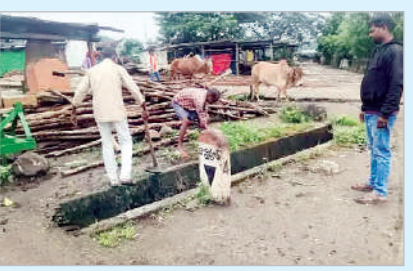
ఊరిలో అంత గిరిజనులే