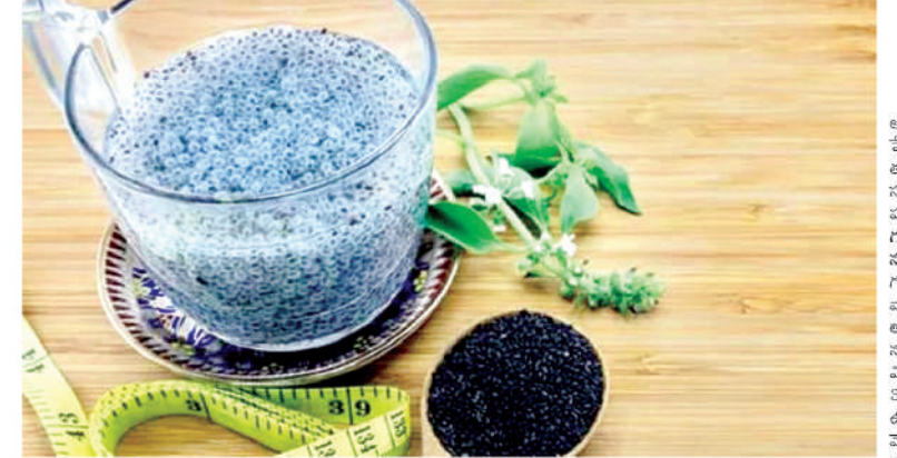
అధిక బరువును తగ్గించడానికి సబ్బా గింజలు అధిక బరువుతో సతమతం అయ్యేవారు అనేక ఆనారోగ్య సమస్యలకు లోనవుతుంటారు. వారు సబ్బా గింజల నీళ్లను తాగడం వలన మంచి ప్రయోజనం ఉంటుంది. కేలరీలు తక్కువగా కలిగిన సబ్బా గింజలలో, మైటో ఎక్కువగా ఉంటుంది, ఇది అర్ధరైస్ సమస్యలు, శ్వాసకోశ సమస్యలు రాకుండా ఉంటాయి. చక్క సంబంధిత వ్యాధులకు సబ్బా గింజలు

మనకు ఆరోగ్య ప్రయోజనాలను ఇచ్చే వాటిలో సబ్బా గింజలు ఒకటి. ఇక ఈ వేసవిలో సబ్బా గింజలు చేసే మేలు అంతా ఇంతా కాదు. వేసవి తాపానికి తట్టడిల్లుతున్న ప్రతిఒక్కరికీ సబ్బా గింజలతో బోలెడన్ని ప్రయోజనాలు కలుగుతాయి. అధిక వేడితో ఇబ్బంది పడేవారు రోజూకు మూడు సార్లు నానెట్టి సబ్బా గింజల నీళ్లు తాగడం వలన వేడి నుండి మి శరీరం చల్లబడి మంచి ఉపశమనం పొందుతారు.