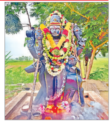
ఏర్పాట్లు చేశామని, అనుభవసాధ వితరణ ఉంటుందని పేర్కొన్నారు.

న్వత కాయంతో మూడు నేత్రాలతో త్రిశూలం, గద, డమరుకుం వంటి వాటిని ధరించిన ఆ భయంకర రూపమే కాలభైరవుడు. అయితే తన జననానికి కారణం చెప్పమని శివుడిని కోరగా.. బ్రహ్మదేవుడి అయిదో శిరస్సు ఖండించమని చెప్పాడట. అజ్ఞమేరకు శిరస్సు ఖండించగా బ్రహ్మదేవుడి గర్వం తగ్గిపోతుందట. కాశీలో ముందుగా కాలభైరవుడిని దర్శించే ఆచారంతోపాటు కాశీ సంతర్పణం కంటే ముందుగా కాలభైరవ సంతర్పణే చేయడం ఆ స్వామి వారి మహత్యమని.. ఆలయ అర్చకుడు వివరించారు. జయంతికి హాజరయ్యే భక్తులకు ఎలాంటి సమస్యలు తలెత్తకుండా