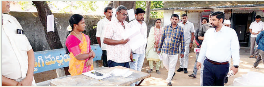
దండేపల్లి, నవంబర్ 28 (ప్రభాత సమాచారం)