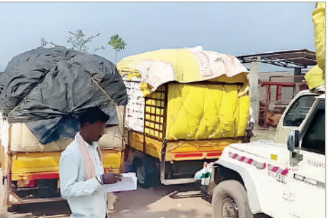
వాంకిడి, నవంబర్ 28 (ప్రభాత సమాచారం)

పత్తి రైతులకు గిట్టుబాటు ధర కల్పించాలనే ఉద్దేశంతో ప్రభుత్వం ఏర్పాటు చేసిన సీసీఐ పత్తి కొనుగోలు కేంద్రాల్లో సీసీఐ ఇష్టానుసారంగా వ్యవహరిస్తున్నారు. స్థానిక ప్రైవేటు వ్యాపారులతో సీసీఐ కుమ్మక్కై తేమ నిబంధనల పేరుతో రైతులను