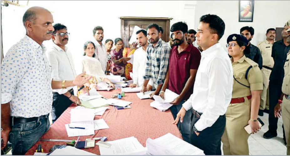
ఆదిలాబాద్, నవంబర్ 29 (ప్రభాత సమాచారం)

జిల్లాలో గ్రామపంచాయతీ ఎన్నికలకు పకడ్బందీగా పోలీసు చర్యలు చేపడుతున్నట్లు. ఎన్నికల నియమావళిని కచ్చితంగా అమలు చేయాలని జిల్లా ఎస్పీ అఖిల్ మహాజన్ ఐపీఎస్ అధికారుల ఆదేశించారు. గ్రామపంచాయతీ ఎన్నికల మొదటి విడతలో చివరి రోజు నామినేషన్ సందర్భంగా ఈరోజు ఇచ్చేద గ్రామపంచాయతీ కార్యాలయంలో