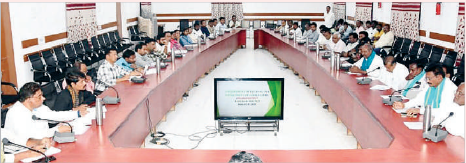
కంపెనీల ప్రతినిధులు, రైతుసంఘాల నాయకులు, వ్యవసాయ విజ్ఞాన కేంద్ర శాస్త్రవేత్తలు, పాల్గొన్నారు.