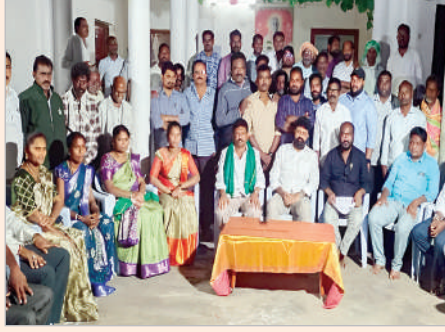
వాదులమని, తమ కాంగ్రెస్ అభ్యర్థులను అందరిని గెలిపించుకుంటామని స్పష్టం చేశారు. మొత్తం 13 మంది సర్పంచ్ అభ్యర్థులను ప్రకటించారు. పెద్దనపల్లి వేముల