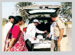
ఉత్సాహ వాహనాలను తనిఖీ చేస్తున్న పోలీసు సిబ్బంది

గ్రామపంచాయతీ ఎన్నికలను ప్రశాంత వాతావరణంలో జరిపించేలా జిల్లా పోలీసు యంత్రాంగం ప్రత్యేక దృష్టి సారించింది. జిల్లా సరిహద్దుల్లో భద్రతను కట్టుదిట్టం చేసింది. ఓటర్లను ప్రలోభ పెట్టే మద్యం, డబ్బు, ఇతర సామగ్రి జిల్లాలోకి రవాణా కాకుండా చెక్పోస్టులు ఏర్పాటు చేశారు. చెక్పోస్టుల వద్ద పోలీసులు, ఇతర శాఖల అధికారుల సమన్వయంతో నిరంతరంగా తనిఖీలు ముమ్మరంగా చేపడుతున్నారు. జిల్లాలో మూడు దశల్లో ఈనెల 11, 14, 17 తేదీల్లో పంచాయతీ ఎన్నికలు జరుగుతున్నాయి. ఇప్పటికే తొలి, మలివిడతల ఎన్నికల నామినేషన్ల ప్రక్రియ పూర్తి కాగా, తుది విడత ఎన్నికల నామినేషన్ల ప్రక్రియ కొనసాగుతోంది. ఈ నేపథ్యంలో జిల్లాలో ఎలాంటి అవాంఛనీయ ఘటనలు చోటు చేసుకోకుండా పోలీసులు బందోబస్తు, తనిఖీలు నిర్వహిస్తున్నారు. సమస్యత్వక కేంద్రాలపై పోలీసులు ప్రత్యేక నిఘా ఏర్పాటు చేశారు. ఇప్పటికే సమస్యత్వక, నెట్వర్క్లను పోలీస్ కేంద్రాలను గుర్తించి పోలీస్ రోజు చేపట్టాల్సిన చర్యలపై కార్యాచరణ సిద్ధం చేశారు. నెట్వర్క్లను పోలీస్ కేంద్రాల్లో సూక్ష్మ పరిశీలకులను, సాధారణ పోలీస్ కేంద్రాల్లో వెబ్ ఆధారంగా పోలీస్ సరళిని పర్యవేక్షించేలా అధికారులు ఏర్పాటు చేస్తున్నారు.