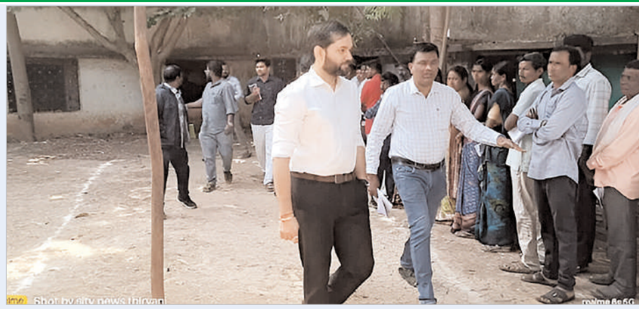
విద్యార్థులకు వేరువేరుగా మూత్రశాలలు, అదనపు గదుల నిర్మాణం, పాఠశాల భవనాల మరమ్మత్తులు, ఇతర అభివృద్ధి పనులను త్వరగా పూర్తి చేసి వినియోగంలోకి తీసుకురావాలని తెలిపారు. బనీతి అయోగ్ కార్యక్రమం