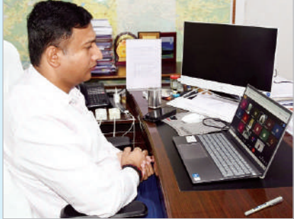
అభ్యర్థుల ఉపసంహరణ, జాబితా