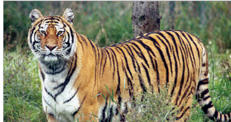
ముఖ్యంగా గొర్రెల కాపరులు, పశువుల కాపరులు అటవీ ప్రాంతానికి వెళ్ళకూడదని అటవీ అధికారులు తెలిపారు.

దస్తూరాబాద్, డిసెంబర్ 6 (ప్రభాత సమాచారం) నిర్మల్ జిల్లా దస్తూరాబాద్ మండలంలోని అడవి ప్రక్కన ఉన్న పలు గ్రామాల ప్రజలతో అటవీ ప్రాంతానికి పులి వస్తుంది అని జాగ్రత్తగా ఉండాలని అటవీశాఖ అధికారులు సూచించారు. ఎవరు కూడా అటవీ ప్రాంతానికి వెళ్ళవద్దు అని ఆ గ్రామ ప్రజలతో అటవీ శాఖ అధికారులు సూచించారు. ఇంధన్ పెళ్లి అటవీ ప్రాంతం నుంచి దస్తూరాబాద్ అటవీ ప్రాంతానికి ఎప్పుడైనా పులి రావచ్చని అన్నారు. ఎవరు కూడా రెండు, మూడు రోజుల వరకు అడవికి వెళ్ళవద్దని పేర్కొన్నారు. పంట చేలకు విద్యుత్ తీగలు అమార్చకూడదని అధికారులు సూచించారు.