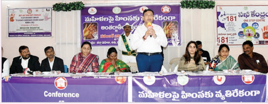
ఆదిలాబాద్, డిసెంబర్ 6 (ప్రభాత సమాచారం)