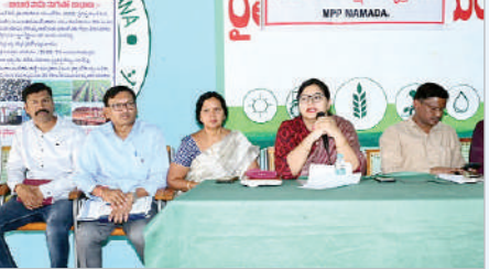
మామడ, డిసెంబర్ 6 (ప్రభాత సమాచారం)