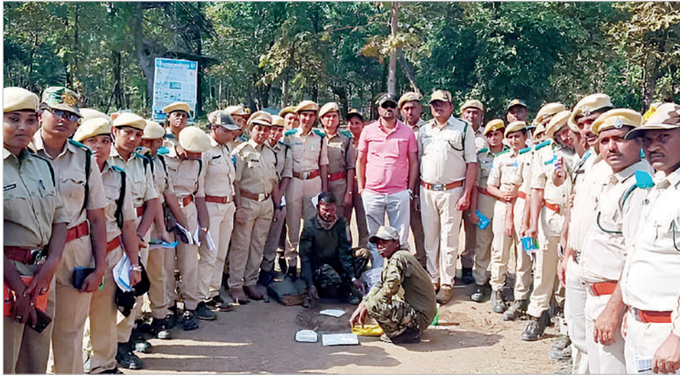
బెజ్జూర్, డిసెంబర్ 8 (ప్రభాత సమాచారం)