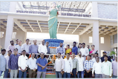
కుటుంబం జిల్లా కలెక్టరేట్లో