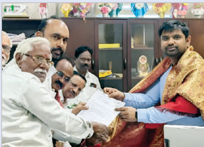
విశ్రాంత ఉద్యోగుల జిల్లా