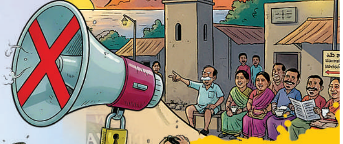
■ వారం రోజులుగా హోరాహోరీగా ప్రచారం ముగిసిన గ్రామ

ఉమ్మడి ఆదిలాబాద్ జిల్లావ్యాప్తంగా తొలి విడుతలో ఎన్నికలు నిర్వహించే గ్రామాల్లో ప్రచారం మంగళవారం సాయంత్రంతో ముగిసింది. మరోవైపు మూడో విడుత ఎన్నికలు నిర్వహించే గ్రామాల్లో నామినేషన్ల ఉపసంహరణ కూడా పూర్తయ్యింది. దీంతో గ్రామాల్లో ఎలక్షన్ హీట్ పెరిగింది. తొలి విడుత ప్రచారం ముగిసిన నేపథ్యంలో అన్ని పార్టీల నాయకులు తమ మద్దతుదారులు పోటీ చేసే రెండో విడుత ఎన్నికలపై ఫోకస్ పెట్టారు. పోటీలో ఉన్న అభ్యర్థుల భవితవ్యం గురువారం తేలిపోనుంది. మొదటి విడుతకు సంబంధించి ఉమ్మడి ఆదిలాబాద్ జిల్లా వ్యాప్తంగా 506 గ్రామాలు, 4,222 వార్డుల్లో ఎన్నికల నిర్వహణకు షెడ్యూల్ విడుదల చేశారు. ఇందులో కొన్ని స్థానాలు ఏకగ్రీవం కావడం, మరికొన్ని స్థానాల్లో అసలు నామినేషన్లు పడకపోవడంతో వాటిని మినహాయించి మిగిలిన స్థానాలకు రేపు(డిసెంబర్ 11న) ఎన్నికలు నిర్వహించనున్నారు. ఈ 24 గంటల వారికి కీలకం కానున్నాయి. ఇప్పటిదాకా బాగుండన్న వారి భవిష్యత్తు తలకిందులు కావచ్చు. అంచనాలు లేకుండానే అనామకులు తెరపైకి దూసుకురావచ్చు. చివరి క్షణంలో ఏదైనా జరగొచ్చు. గురువారం 11న ఉదయం 7 నుంచి మధ్యాహ్నం ఒంటి గంట వరకు ఓటింగ్ ఉంటుంది. అదేరోజు మధ్యాహ్నం 2గంటల నుంచి ఓట్ల లెక్కించి, సాయంత్రం వరకు ఫలితాలు వెల్లడిస్తారు.