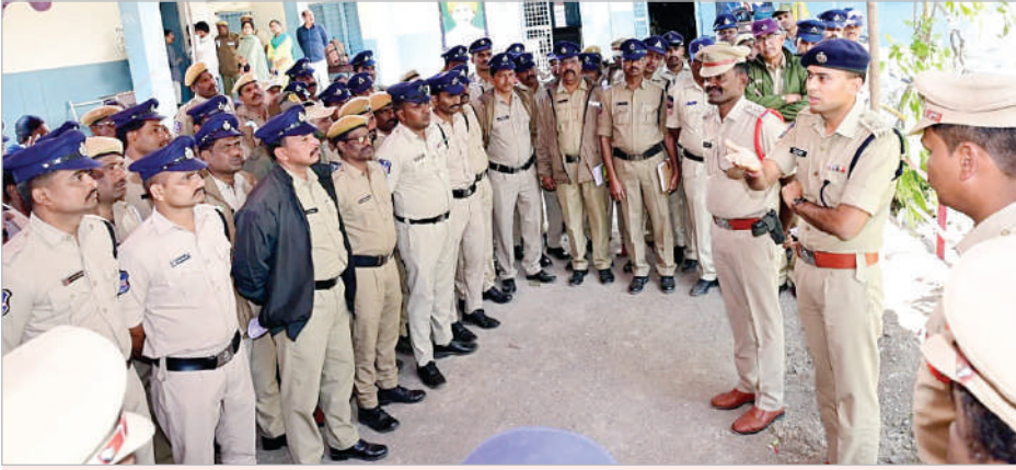
ఆదిలాబాద్, డిసెంబర్ 10 (ప్రభాత సమాచారం)

గ్రామపంచాయతీ ఎన్నికలకు జిల్లా పోలీసు వ్యవస్థ పకడ్బందీగా ఏర్పాట్లు పూర్తి చేసినట్లు జిల్లా ఎస్పీ అఖిల్ మహాజన తెలియజేశారు. జిల్లా వ్యాప్తంగా మొదటి విడతలో భాగంగా 6 మండలాలలో ఎన్నికలు జరగనుండగా అందులో 39 క్లస్టర్లు, 34 రూల్ లతో, 166 గ్రామాల నందు 225 పోలింగ్ లొకేషన్లలో ఎన్నికలు జరగనున్నాయి. అందులో భాగంగా జిల్లా వ్యాప్తంగా 938 మంది పోలీసు సిబ్బందితో పటిష్టమైన బందోబస్తును ఏర్పాటు చేయడం జరిగింది అని తెలిపారు. ఇప్పటివరకు జిల్లా ఎస్పీ స్వయంగా 38 గ్రామాల నందు ఫ్లాగ్ మార్చ్ లు నిర్వహించి, ప్రజలను ఓటు హక్కు పై అవగాహన కల్పించి నిర్భయంగా ఓటు హక్కును వినియోగించుకోవాలని, ప్రలోభాలకు గురి కాకూడదని తెలిపారు. ఈరోజు నుండి పోలింగ్ స్టేషన్లో పరిధిలో 163 బిఎన్ఎస్ఎస్ (144 సెక్షన్) అమలులో ఉంటుందని, ప్రజలు గుమ్మిగుడి ఉండకుండా, గొడవలకు అల్లర్లకు దారి తీయకుండా ప్రశాంతంగా ఓటు హక్కును వినియోగించుకొని ఇళ్లకు చేరుకోవాలని తెలిపారు. ఇప్పటివరకు జిల్లాలో సమస్యలు సృష్టించేటటువంటి వారినీ, ఎన్నికలను గొడవలు సృష్టించే వారినీ 598 మందిని బైఠోవర్ చేయడం జరిగిందన్నారు. ఎన్నికల నేపథ్యంలో జిల్లా వ్యాప్తంగా 20 మంది వద్ద ఉన్న ఆయుధాలను సేఫ్ డిపాజిట్ చేయడం జరిగిందన్నారు. ఈ బందోబస్తు నందు ఫార్మెస్ట్, టీజిఎస్సీ, ఎసిటిపిసి సిబ్బంది పాల్గొంటున్నట్లు తెలిపారు. జిల్లా వ్యాప్తంగా మూడు విడతలలో 128(40 మొదటి విడత) క్రిటికల్ పోలింగ్