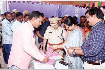
ఖానాపూర్, డిసెంబర్ 10 (ప్రభాత సమాచారం)