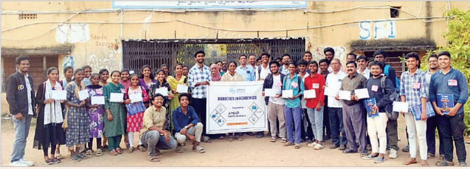
కాగజ్ నగర్, డిసెంబర్ 16 (ప్రభాత సమాచారం) కాగజ్ నగర్ ప్రభుత్వ డిగ్రీ కళాశాలలో మంగళవారం కళాశాల ఫిజిక్స్ విభాగం ఆధ్వర్యంలో రోబోటిక్స్ పై ప్రత్యేక