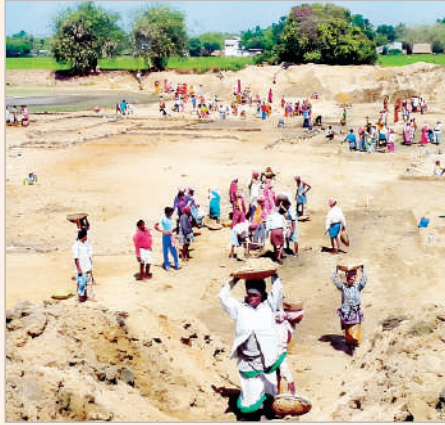
మహాత్మా గాంధీ జాతీయ గ్రామీణ ఉపాధి హామీ చట్టం స్థానంలో కొత్త చట్టాన్ని తీసుకొచ్చేందుకు మోడీ సర్కార్ సిద్ధమైంది. 'వికసిత భారత్ 2047' లక్ష్యానికి అనుగుణంగా.. ప్రస్తుతం 100 రోజుల పని హామీని 125 రోజులకు పెంచుతూ 'వికసిత భారత్- గ్యారంటీ ఫర్ రోజ్ గాజ్' అనే అజీవికా మిషన్ (గ్రామీణ్) బిల్లు 2025'ను లోక్ సభ సభ్యులకు ప్రభుత్వం సర్కులార్ చేసింది. ఈ బిల్లును ప్రవేశ పెట్టేందుకు సమయాత్తం అవుతోంది.

(ప్రభాత సమాచారం, ప్రత్యేక ప్రతినిధి) పల్లెల్లో ఉపాధి హామీ విధానంలో కీలక మార్పులకు కేంద్రం శ్రీకారం చుట్టింది. ప్రస్తుత మహాత్మా గాంధీ జాతీయ గ్రామీణ ఉపాధి హామీ చట్టం స్థానంలో కొత్త చట్టాన్ని తీసుకు రావడానికి కేంద్ర ప్రభుత్వం చర్యలు వేగవంతం చేసింది. ఈ మేరకు కొత్త బిల్లును ప్రభుత్వం లోక్ సభ సభ్యులకు అందజేసింది. గ్రామీణ ఉపాధి హామీ కోసం-2005లో రూపొందించిన ఎంజీఎన్ఆర్ ఈజీవీ చట్టాన్ని రద్దు చేసి.. దాని స్థానంలో 'వికసిత భారత్-గ్యారంటీ ఫర్ రోజ్ గాజ్' అనే అజీవికా మిషన్ (గ్రామీణ్) బిల్లు 2025'ను ప్రస్తుత పార్లమెంట్ శీతాకాల సమావేశాల్లో మంగళవారం ఈ బిల్లును లోక్ సభలో ప్రవేశపెట్టింది.