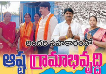
అందరి సహకారంతో ఆష్ట గ్రామాభివృద్ధి