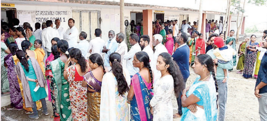
నాలుగు మండలాల్లో పోలింగ్ కేంద్రాలను పరిశీలించిన ఐజీ, కలెక్టర్, ఎస్పీలు 83.32 శాతం పోలింగ్ - 104 పంచాయతీల్లో ఓటు హక్కు వినియోగించుకున్న 1,00,815 మంది ఓటర్లు