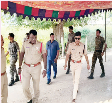
ఆదేశించారు. పోలింగ్ ముగిసిన అనంతరం ఓట్ల లెక్కింపు, బ్యాలెట్ బాక్సుల తరలింపు సమయంలో, విధి నిర్వహణలో అప్రమత్తంగా ఉండాలని పోలీసు అధికారులకు, సిబ్బందికి సూచించారు.