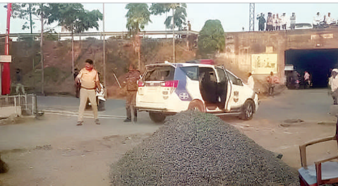
గుడిహత్కూర్, డిసెంబర్ 17 (ప్రభాత సమాచారం) ఆదిలాబాద్ జిల్లాలోని గుడిహత్కూర్ మండలంలో గల సీతగిరి గ్రామంలో కౌంటింగ్ కేంద్రం వద్ద ఉబ్బిక్తత నెలకొంది. గుడిహత్కూర్ వారిని చెదరగొట్టే ప్రయత్నంలో ఘర్షణకు