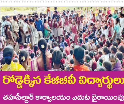
రోడ్డెక్కిన కేజీబీవీ విద్యార్థులు తహసీల్దార్ కార్యాలయం ఎదుట బైరాయింపు