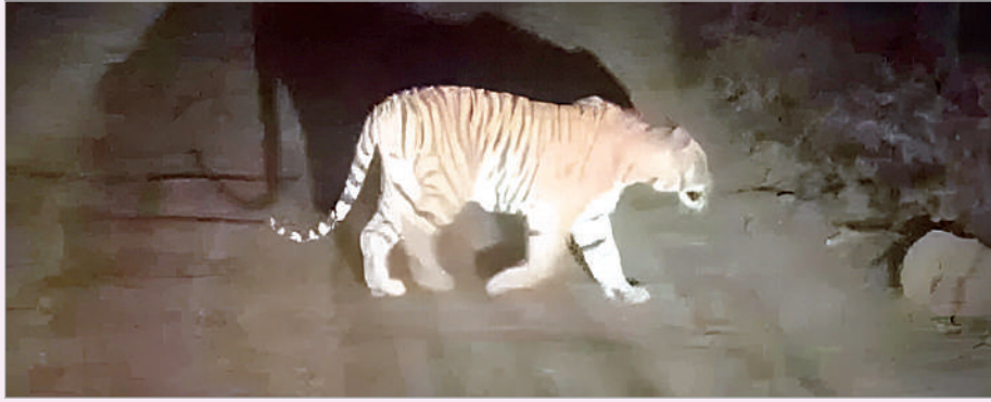
కాసిపేట, డిసెంబర్ 20 (ప్రభాత సమాచారం) శివారులో పెద్దపులి సంచారం అలజడి సృష్టిస్తుంది. బుగ్గ దేవాలయం సమీపంలో పెద్దపులిని ప్రత్యక్షంగా చూసిన