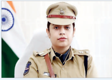
అలాగే లైసెన్సులు లేకుండా డ్రైవింగ్ చేయకూడదని చెప్పారు.