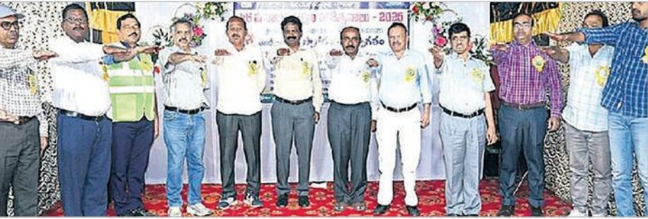
రెవెన్యూ, డిసెంబర్ 20 (ప్రభాత సమాచారం)