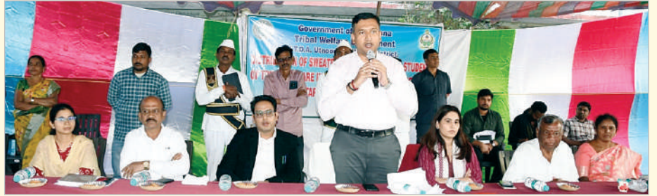
■ లక్ష్మసాధనకు కష్టపడి చదవాలి