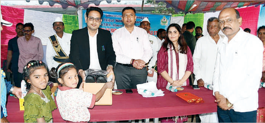
ఆదిలాబాద్, డిసెంబర్ 20 (ప్రభాత సమాచారం)