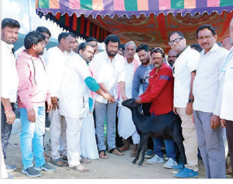
నాయకులు, కార్యకర్తలు పాల్గొన్నారు.