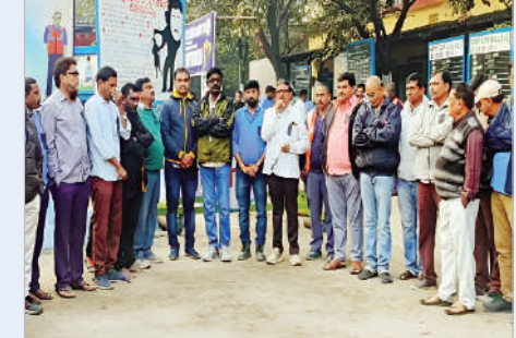
డిమాండ్ చేశారు. వేల కోట్లు లాభాలు తెచ్చి పెడుతున్న సింగరేణి కార్మికులు, ఉద్యోగులు ఎంతో అట్టహాసంగా

సింగరేణి వ్యాప్తంగా సింగరేణి డి వేడుకలను పెద్ద ఎత్తున అట్టహాసంగా నిర్వహించకుండా తూతూ మంత్రంగా నిర్వహించాలనే యాజమాన్య నిర్ణయానికి వ్యతిరేకంగా గుర్తింపు సంఘం ఏబిటియూసీ ఆధ్వర్యంలో శ్రీరాంపూర్ ఓసిపిలో నల్ల బ్యాడ్జీలు ధరించి నిరసన తెలిపారు. యాజమాన్యం తీసుకున్న ఈ నిర్ణయాన్ని వెంటనే పునఃసమీక్షించి, సింగరేణి డి వేడుకలను గౌరవప్రదంగా నిర్వహించాలని