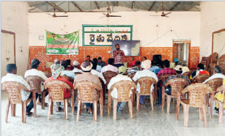
బంధించి ధర్మారం, చింతలపల్లి, మరియు లింగయ్య పల్లె గ్రామాలకు సంబంధించిన 125 ఎకరాల భూమిని ఎంపిక