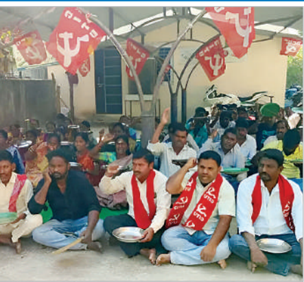
కాగజేనగర్, డిసెంబర్ 25 (ప్రభాత సమాచారం) కాగజేనగర్ పట్టణ మున్సిపల్ కార్యాలయం ఎదుట