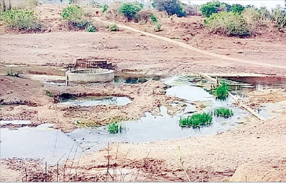
కెరమెరి, డిసెంబర్ 27 (ప్రభాత సమాచారం) భారీ వర్షాలు కురిస్తే చాలా ఆ గ్రామాల ప్రజలు ఆరిగోస పడాలింది. కెరమెరి మండలంలో దశాబ్దం క్రితం మొదలు పెట్టిన వంతెన నిర్మాణ పనులు పూర్తి కాక పోవడంతో ప్రతి

ఏటా వర్షాకాలంలో ప్రజలు తీవ్ర ఇబ్బందులు పడుతున్నారు. వాగులు పొంగితే సాహసం చేయక తప్పడం లేదు. మండలంలోని అనారోపల్లి, లక్కాపూర్ వాగులపై వంతెనలు లేక ప్రజలు ఇబ్బందులు పడుతున్నారు. ఇటీవల జిల్లాలో