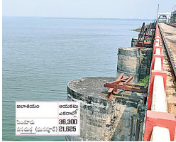
సీజన్లకు సాగునీటిని అందించడం సాధ్యం కాదని నీటిపారుదల శాఖ అధికారులు చెబుతున్నారు. సింగూరు నుంచి విడుదలయ్యే నీటితోనే మెదక్ జిల్లా ఘనపూర్ ఆనకట్ట కింద పంటలు పండిస్తున్నారు.

ఎన్డీఎస్ఎ (నేషనల్ డ్యాం సేఫ్టీ అథారిటీ) ఆదేశాలతో ఎన్డీఎస్ఎ హెచ్చరికలతో సింగూరు జలాశయం రివిల్ కు మరమ్మతులు చేపట్టేందుకు నీటిపారుదల శాఖ కనరత్తు చేస్తోంది. ఇటీవలే సాంకేతిక కమిటీ ప్రాజెక్టును సందర్శించి మరమ్మతులు చేపట్టాలని సూచించింది. దీంతో ప్రాజెక్టు నీటిని దిగువకు విడుదల చేసేందుకు ప్రభుత్వం నుంచి అనుమతి కోరుతూ ప్రతిపాదనలు పంపించారు. ప్రభుత్వం ఆమోదం తెలుపగానే ఈ నెలఖరలోపు నీటిని దిగువకు విడుదల చేయాలని నిరయించింది. వచ్చే నెలఖరలో పనులు ప్రారంభించాలని నిరయించారు. ఈ సీజన్లో పాటు మరో నాలుగు