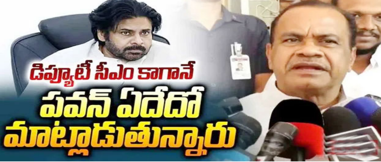
డిప్యూటీ సీఎం కాగానే పవన్ ఏదేదో మాట్లాడుతున్నారు

హైదరాబాద్: తెలంగాణ రాజభవన్ పేరును లోక్ భవన్ గా మారుస్తూ రాష్ట్రప్రభుత్వ నోటిఫికేషన్ జారీ చేసింది. అన్ని రాజభవన్లను లోక్ భవన్ గా మార్చాలని కేంద్ర ప్రభుత్వం సూచించింది. ఈ నేపథ్యంలో రాష్ట్ర ప్రభుత్వం ఉత్తర్వులు జారీ చేసింది. వలసవాద వాసనలను తుడిచిపెట్టేందుకు.. రాజభవన్, రాజ్ నివాసల పేర్లను లోక్ భవన్, లోక్ నివాసలుగా మార్చే అంశాన్ని పరిశీలించాలని గవర్నర్లు, లెఫ్టినెంట్ గవర్నర్లకు సూచించి ఇటీవల కేంద్ర హోంమంత్రిత్వ శాఖ రాసిన లేఖకు అనుగుణంగా చాలా రాష్ట్రాల్లో చర్యలు తీసుకుంటున్నారు. ఇప్పటికే పశ్చిమబెంగాల్, తమిళనాడు, గుజరాత్, అస్సాం, కేరళ, త్రిపుర, ఒడిశా రాజభవన్లను లోక్ భవన్లుగా మార్చారు. ఇప్పుడు ఆ జాబితాలో తెలంగాణ కూడా చేరింది.