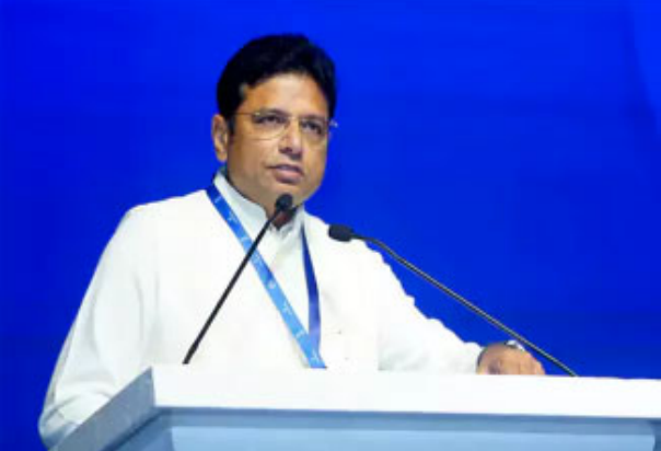
హైదరాబాద్: దేశంలోనే మొట్టమొదటిసారిగా తెలంగాణలో డ్రాస్ట్రోక్ ప్రత్యేక డిఫెన్స్ ఫెసిలిటీని జేఎన్‌డబ్ల్యూ కంపెనీ ఏర్పాటు చేశారు.