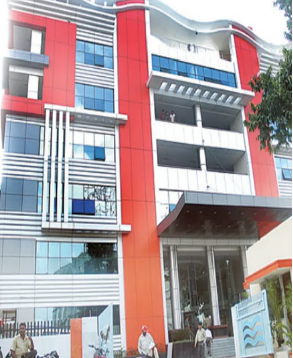
హైదరాబాద్ : నిబంధనలకు విరుద్ధంగా భవనాలను నిర్మించి భారీ మొత్తంలో తాగునీటిని వినియోగించుకుంటున్న వారిపై

జలమండలి కొరడా రులిపిస్తోంది. వారి నుంచి మూడింతల బిల్లులు వసూలు చేస్తోంది. జలమండలి పరిధిలో 14.6 లక్షల నీటి కనెక్షన్లు ఉన్నాయి. ప్రతి నెలా 3 వేల వరకు అదనంగా చేరుతున్నాయి. కనెక్షన్లు పెరుగుతున్నా రాబడి పెరగకపోవడంపై జలమండలి దృష్టిసారించింది. ఏం జరుగుతుందంటే.. జీహెచ్ఎస్ పరిధిలో నిర్మాణ నిబంధనల ఉల్లంఘనలు యథేచ్ఛగా సాగుతున్నాయి. రెండు, మూడు అంతస్తులకు అనుమతులు తీసుకుని నాలుగు లేదా ఐదు నిర్మిస్తున్నారు. సెల్ఫ్యాక్స్ పాటించకుండా ఆ స్థలాల్లోనూ నిర్మాణాలు చేస్తున్నారు. జలమండలి నీటి కనెక్షన్లకు జీహెచ్ఎస్ నుంచి ఆక్యుపెన్సీ సర్టిఫికేట్ (ఓసీ) తప్పనిసరి. అది ఉంటే జలమండలి సాధారణ నీటి ఛార్జీలనే వసూలు చేస్తుంది. చాలా చోట్ల నిర్మాణాల్లో అనుమతులను ఉల్లంఘించడం లేదా ఓసీ తీసుకున్న తర్వాత కొత్త నిర్మాణాలు చేయడం సాధారణంగా మారింది. దీంతో జలమండలి నీటికి డిమాండ్ పెరుగుతోంది. మరోవైపు జలమండలి సిబ్బందితో లోపాయికారీ అవగాహనతో నీటిని ఎక్కువ పరిమాణంతో వినియోగించుకుంటున్నారు. ఇలా చేస్తారు.. కొత్త నిర్మాణాలకు నీటి కనెక్షన్లకు దరఖాస్తు చేసుకుంటే ఆక్యుపెన్సీ సర్టిఫికేట్ ఉన్నా జలమండలి ప్రత్యేకంగా నిర్మాణాల కొలతలు తీసుకుని నిర్ధారించుకుంటుంది. పాత కనెక్షన్లు ఉన్నచోట అనుమతుల మేరకు భవన నిర్మాణాలు ఉన్నాయా? లేదంటే మార్పులు చేశారా? ఫోటోలు పెరిగాయో? అని పరిశీలిస్తున్నారు. నిబంధనల ఉల్లంఘన ఉంటే సాధారణం కంటే మూడు రెట్లు నీటి ఛార్జీలు వసూలు చేస్తున్నారు.