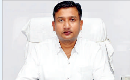
విధంగా బహుమతులు తీసుకురావాలని కలెక్టర్ కోరారు. దీనివల్ల విద్యార్థుల్లో చదువుపై ఆసక్తి పెరిగి, పఠన అలవాటు