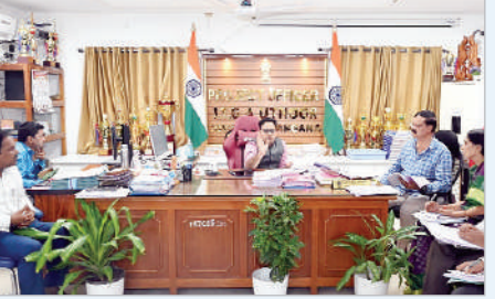
ఉట్లాద్, జనవరి 2 (ప్రభాత సమాచారం) ఐటిడిఎ పరిధిలో అమలవుతున్న అభివృద్ధి కార్యక్రమాల పురోగతిని శుక్రవారం ఐటిడిఎ పిఠి యువరాజ్ మర్కాట్

ఐటిడిఎ పిఠి యువరాజ్ మర్కాట్ సమీక్షించారు. ఈ సమావేశంలో భాగంగా అన్ని శాఖల పనితీరును క్షుణ్ణంగా పరిశీలించి, ఐటిడిఎ పరిధిలో చేపడుతున్న అభివృద్ధి పనులు ఎలాంటి ఆటంకాలు లేకుండా వేగంగా పూర్తి చేయాలని అధికారులకు ఆదేశించారు. ప్రజావాణి ద్వారా అందుతున్న దరఖాస్తులపై సకాలంలో చర్యలు తీసుకొని సమస్యల పరిష్కారానికి ప్రాధాన్యత ఇవ్వాలని సూచించారు. అదేవిధంగా, ఏవైనా అక్రమ డిప్యూటీషన్లు ఉన్నట్లుంటే వాటిని తక్షణమే రద్దు చేయాలని గిరిజన సంక్షేమ శాఖ అధికారులను ఆదేశించారు. పిల్లలకు సముచితమైన పౌష్టికాహారం అందేలా అవసరమైన చర్యలు చేపట్టాలని, ఈ విషయంలో