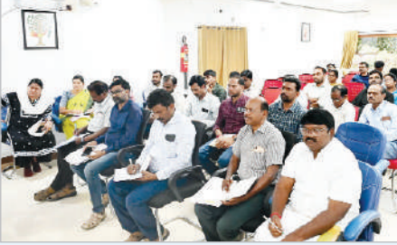
ఎలాంటి నిర్లక్ష్యం ఉండకూడదని స్పష్టం చేశారు. అలాగే, ప్రతి వారం అభివృద్ధి పనుల పురోగతిపై సంబంధిత శాఖలు నివేదికలు సమర్పించాలని ఆయన ఆదేశించారు.

ఐటిడిఎ పిఠి యువరాజ్ మర్కాట్ సమీక్షించారు. ఈ సమావేశంలో భాగంగా అన్ని శాఖల పనితీరును క్షుణ్ణంగా పరిశీలించి, ఐటిడిఎ పరిధిలో చేపడుతున్న అభివృద్ధి పనులు ఎలాంటి ఆటంకాలు లేకుండా వేగంగా పూర్తి చేయాలని అధికారులకు ఆదేశించారు. ప్రజావాణి ద్వారా అందుతున్న దరఖాస్తులపై సకాలంలో చర్యలు తీసుకొని సమస్యల పరిష్కారానికి ప్రాధాన్యత ఇవ్వాలని సూచించారు. అదేవిధంగా, ఏవైనా అక్రమ డిప్యూటీషన్లు ఉన్నట్లుంటే వాటిని తక్షణమే రద్దు చేయాలని గిరిజన సంక్షేమ శాఖ అధికారులను ఆదేశించారు. పిల్లలకు సముచితమైన పౌష్టికాహారం అందేలా అవసరమైన చర్యలు చేపట్టాలని, ఈ విషయంలో