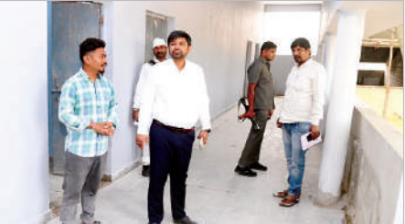
చెన్నూర్, జనవరి 2 (ప్రభాత సమాచారం)

ప్రభుత్వ పాఠశాలలు, కళాశాలలను చేపట్టిన అభివృద్ధి పనులను వేగవంతం చేసి త్వరగా పూర్తిచేసి విధంగా చర్యలు తీసుకోవాలని జిల్లా కలెక్టర్ కుమార్ దీపక్ అన్నారు. శుక్రవారం జిల్లాలోని చెన్నూర్ మండలం కిష్టంపేటలో గల ప్రభుత్వ డిగ్రీ కళాశాలలో కొనసాగుతున్న అదనపు గదుల నిర్మాణ పనులను పరిశీలించి అధికారులకు పలు సూచనలు చేశారు.