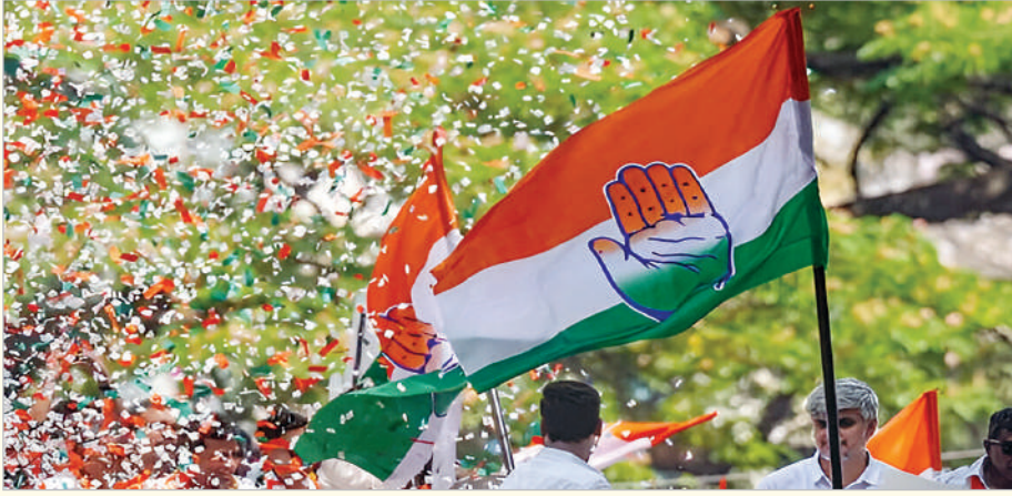
(ప్రభాత సమాచారం, ప్రత్యేక ప్రతినిధి)

కార్పొరేషన్, మున్సిపాలిటీలోని ప్రతి వార్డుల్లో రిజిస్ట్రేషన్ల ఆధారంగా ఒక్కో స్థానానికి ముగ్గురు అభ్యర్థుల చొప్పున ఎంపిక చేసి లిస్టును పీసీసీకి పంపాలని జిల్లాలోని డి.సీ.లకు పీసీసీ నుంచి ఆదేశాలు అందినట్లు తెలుస్తుంది. సామాజిక న్యాయానికి అధిక ప్రాధాన్యత ఇస్తున్న కాంగ్రెస్ పార్టీ బీసీలకు 42 శాతం రిజిస్ట్రేషన్ ఇస్తామన్న అంశాన్ని పరిగణనలోకి తీసుకోనున్నట్లు సమాచారం. మున్సిపల్ కార్పొరేషన్