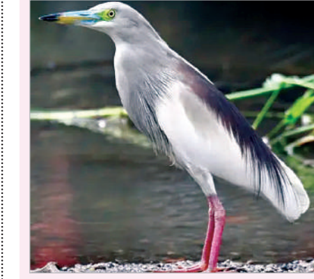
అరుదుగా కనిపించే.. ఎర్రకాళ్ల కొక్కిరాయి..!