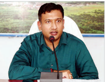
ఆదిలాబాద్, జనవరి 2 (ప్రభాత సమాచారం) విద్యార్థుల్లో క్రీడా, సాంస్కృతిక నైపుణ్యాలను పెంపొందించడం మేలక్ష్యంగా ప్రభుత్వం విస్తృతంగా నిధులు వెచ్చించి ప్రోత్స

హిస్తున్నదని జిల్లా కలెక్టర్ రాజర్షి షా తెలిపారు. శుక్రవారం కలెక్టర్ సమావేశ మందిరంలో, బోఫ్ సాంఘిక సంక్షేమ బాలికల పాఠశాలలో పర్యాటక శాఖ స్పాన్సర్షిప్ తో నిర్వహించనున్న క్రీడా, సాంస్కృతిక కార్యక్రమాల ఏర్పాట్లపై అధికారులతో జిల్లా కలెక్టర్ సమీక్షా సమావేశం నిర్వహించారు. ఈ సందర్భంగా కలెక్టర్ మాట్లాడుతూ, విద్యార్థుల్లో దాగి ఉన్న క్రీడా, సాంస్కృతిక ప్రతిభను వెలికితీయడం, ప్రోత్సహించడం లక్ష్యంగా ప్రభుత్వం అనేక కార్యక్రమాలు చేపడుతోందని తెలిపారు. అందులో భాగంగా బోఫ్ సాంఘిక సంక్షేమ బాలికల పాఠశాలలో నిర్వహించనున్న క్రీడా, సాంస్కృతిక కార్యక్రమాలకు రూ. 25 లక్షలు మంజూరు చేసినట్లు వెల్లడించారు. విద్యార్థులకు అవసరమైన క్రీడా దుస్తులు, షూస్, క్యాప్స్, టీమ్ లోగోలు సిద్ధం చేయాలని, కార్యక్రమ నిర్వహణ ప్రదేశంలో ఎల్.ఈ.డి ప్రాజెక్టర్లను ఏర్పాటు చేయాలని