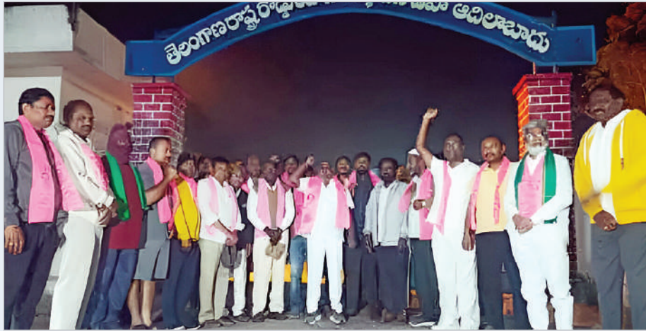
ఆదిలాబాద్, జనవరి 6 (ప్రభాత సమాచారం)

అన్నదాత పండించిన పంటల కొనుగోళ్లలో నిబంధనలను తొలగించాలని, పండిన ప్రతి గింజను ప్రభుత్వం మద్దతు ధరతో కొనుగోలు చేసి రైతుల ఇక్కులు దూరం చేయాలని మాజీ మంత్రి జోగు రామన్న డిమాండ్ చేశారు. రైతుల సమస్యలపై బీఆర్ఎస్ ఆధ్వర్యంలో చేపడుతున్న పోరుబాటలో భాగంగా మంగళవారం ఆదిలాబాద్ పట్టణ బండ్కు