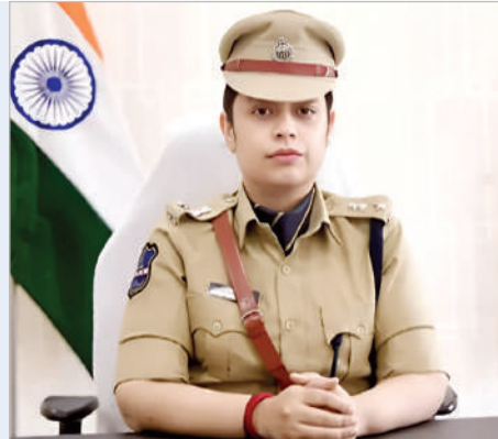
100కు పోస్ చేయాలని సూచించారు.

ఉంచుతారని వివరించారు. ఇళ్లకు తాళాలు వేసి వెళ్లేటప్పుడు నగదు, బంగారం తదితర విలువైన వస్తువులను ఇంట్లో ఉంచుకొనడం ఎస్పీ ప్రజలకు సూచించారు. వాటిని బ్యాంకు లాకర్లలో లేదా ఇతర సురక్షిత ప్రాంతాల్లో భద్రపరుచుకోవడం ఉత్తమమని చెప్పారు. ఈ చిన్నపాటి జాగ్రత్తలు పాటిస్తే చోరీలను నివారించి పండుగను ప్రశాంతంగా జరుపుకోవచ్చని పేర్కొన్నారు. నేరాలను ముందుగానే నివారించడంలో ప్రజల సహకారం పోలీసులకు ఎంతో అవసరమని అభిప్రాయపడ్డారు. పండుగ సీజన్ లో శాంతిభద్రతల పరిరక్షణకు, ప్రజల భద్రతకు పోలీస్ శాఖ కట్టుబడి ఉందని తెలిపారు. అత్యవసర పరిస్థితుల్లో వెంటనే దుయల్