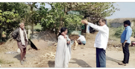
ప్రాథమిక స్థూత పాఠశాలలో నిర్వహిస్తున్న మధ్యాహ్న భోజన పథకాన్ని పరిశీలించి విద్యార్థులకు అందిస్తున్న భోజనంలో పౌష్టికాహారం అందించకుండా, నియమ నిబంధనలు పాటించకుండా వ్యవహరిస్తున్న తీరుపై పాఠశాల హెడ్ మాస్టర్పై ఆగ్రహం వ్యక్తం చేస్తూ, మండల విద్యాధికారికి ఆదేశాలు జారీ చేశారు. మండలంలోని వివిధ గ్రామ పంచాయతీలలో అధికారులు నిర్లక్ష్యంగా వ్యవహరిస్తున్నారని అధికారుల తీరుపై ఆయన మండిపడ్డారు. వివిధ శాఖల అధికారులు పాల్గొన్నారు.