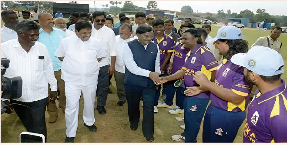
మండమర్రె, జనవరి 10 (ప్రభాత సమాచారం) పట్టణ, గ్రామీణ ప్రాంతంలో ఉన్న క్రికెట్ క్రీడాకారులను ప్రోత్సహించేందుకు హైదరాబాద్ క్రికెట్ అసోసియేషన్,

విశాఖ ఇండస్ట్రీస్ ఆధ్వర్యంలో దివంగత కాకా వెంకటస్వామి మెమోరియల్ క్రికెట్ లీగ్ పోటీలు నిర్వహిస్తున్నామని రాష్ట్ర కార్మిక ఉపాధికల్పన గనులశాఖ మంత్రి డాక్టర్