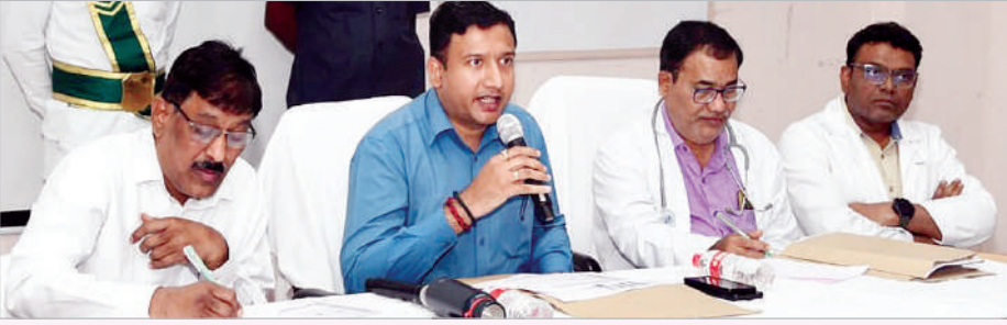
ఆదిలాబాద్, జనవరి 10 (ప్రభాత సమాచారం)