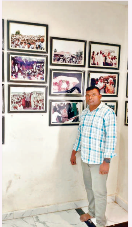
ప్రతి ఒక్కరూ జీవ వైవిధ్యాన్ని కాపాడాలని అంటున్నాడు.

సమాజ హితం కోసం తన సేవలను పేద ప్రజల కోసం అంకితం చేస్తున్నాడు. చెట్లే జీవకోటికి జీవనాధారం చెట్లే జీవకోటికి జీవనాధారమని ప్రతి ఇంటి ఆవరణతో పాటు పరిసరాల్లో మొక్కలను నాటి పర్యావరణ పరిరక్షణకు కృషి చేయాలని సూచిస్తున్నాడు. కాలాధ్యాన్ని తగ్గించాలనే