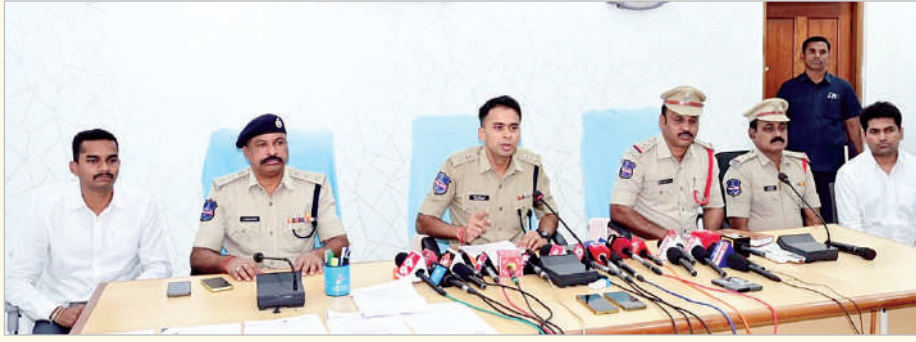
ఆదిలాబాద్, జనవరి 10 (ప్రభాత సమాచారం)