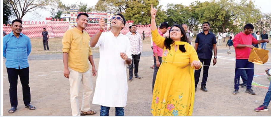
అగరుచేసి సంక్రాంతి ఉత్సవాలను ప్రారంభించారు. జిల్లా ప్రజలందరికీ చైనా మాంజా వినయోగించకుండా ఉండాలని సూచించారు. నిర్వహించిన ముగ్గుల పోటీలో విజేతలుగా నిలిచిన మహిళ పోలీసు సిబ్బందికి అభినందనలు తెలియజేసి, బహుమతులను అందజేశారు. సిబ్బంది సమక్షంలో

నిర్వహించారు. ఈ కార్యక్రమంలో పోలీసు సిబ్బంది అధికారులు కిందిస్థాయిలోని పై స్థాయి అధికారులు సంతోషంగా కుటుంబ సభ్యులతో ఆనందంగా పండుగ సందరాలను జరుపుకున్నారు. స్వయంగా జిల్లా ఎస్పీ మరియు అధికారులు సిబ్బంది సమక్షంలో పతంగులైన