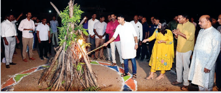
ఆదిలాబాద్, జనవరి 10 (ప్రభాత సమాచారం) రానున్న సంక్రాంతి సందర్భంగా ఆదిలాబాద్ పోలీస్ హెడ్ క్వార్టర్స్ నందు జిల్లా పోలీసు సిబ్బందికి సంక్రాంతి శుభాకాంక్షలు తెలియజేశారు. పోలీసు హెడ్ క్వార్టర్స్ లోనే ముందుగా సిబ్బంది సమక్షంలో సంక్రాంతి సందరాలను

నిర్వహించారు. ఈ కార్యక్రమంలో పోలీసు సిబ్బంది అధికారులు కిందిస్థాయిలోని పై స్థాయి అధికారులు సంతోషంగా కుటుంబ సభ్యులతో ఆనందంగా పండుగ సందరాలను జరుపుకున్నారు. స్వయంగా జిల్లా ఎస్పీ మరియు అధికారులు సిబ్బంది సమక్షంలో పతంగులైన