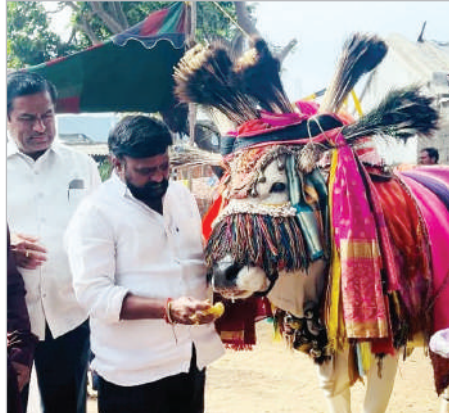
పండుగల విలువలను ఆనందంగా నేర్చుకున్నారు. ఈ కార్యక్రమం ద్వారా విద్యార్థుల్లో మన సంస్కృతి,

జనవరి 10 (ప్రభాత సమాచారం) జనవరి 10న శ్రీ కృష్ణవేణి టాలెంట్ స్కూల్ లో సంక్రాంతి వండుగను పురస్కరించుకొని సంక్రాంతి సంబరాలు ఘనంగా నిర్వహించారు. ఈ సందర్భంగా పాఠశాల ప్రాంగణంలో సంప్రదాయాలకు ప్రతీకగా గ్రామీణ సంస్కృతిని సజీవంగా రూపకల్పన చేశారు. ఈ కార్యక్రమంలో భాగంగా గ్రామీణ జీవన విధానాన్ని ప్రతిబింబించేలా వివిధ వృత్తుల పనులను స్టాల్స్ రూపంలో ఏర్పాటు చేసి, వాటి ప్రాముఖ్యతను చిన్నారలకు వివరించారు. భోగి వండుగ సందర్భంగా భోగి మంటలు, భోగి పండ్లు, గంగిరెడ్డులు, ఎడ్లపండ్లు, రైతు చేసే పనులు, వ్యవసాయానికి సంబంధించిన సంప్రదాయాలు వంటి అంశాలను ప్రత్యక్షంగా చూపిస్తూ పిల్లలకు అవగాహన కల్పించారు. ప్రతి స్టాల్ వద్ద పిల్లలు చురుకూగా పాల్గొని, గ్రామీణ జీవన విధానం, రైతు ప్రాముఖ్యత, సంప్రదాయ