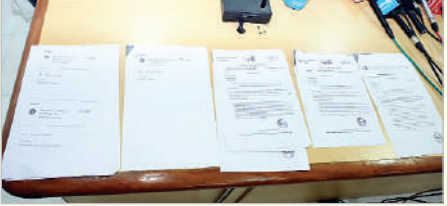
చేశారన్నారు. వీరు నకిలీ అపాయింట్మెంట్ ఆర్డర్లతో ఉద్యో