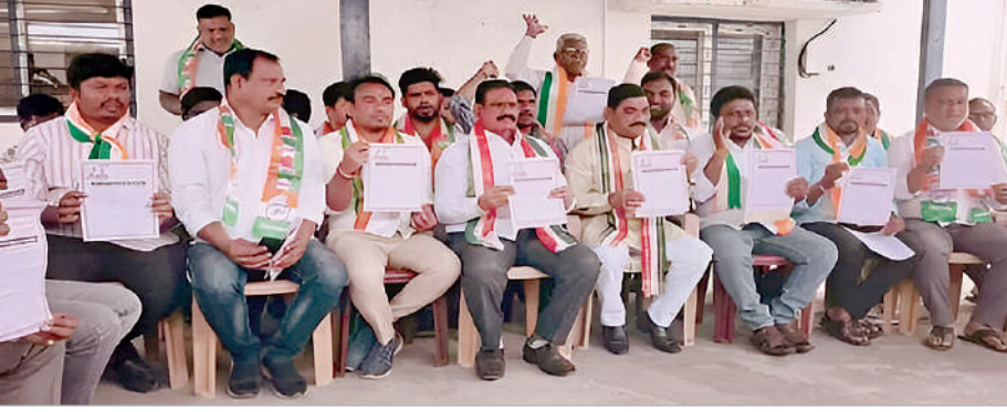
మండలమరి, జనవరి 10 (ప్రభాత సమాచారం) దేశ వ్యాప్తంగా పేదల జీవనోపాధికోసం గతంలో కేంద్రంలోని తమ ప్రభుత్వం ప్రవేశపెట్టిన మ హాత్మాంధీ