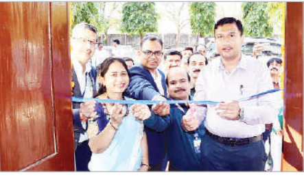
ఆదిలాబాద్, జనవరి 12 (ప్రభాత సమాచారం)