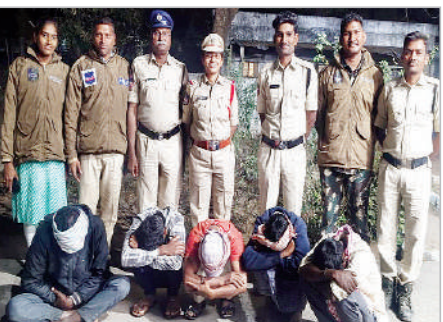
జన్నారం, జనవరి 16 (ప్రభాత సమాచారం) మంత్రాలు చేస్తున్నాడని అనుమానంతో కరెంటు షాక్ పెట్టి