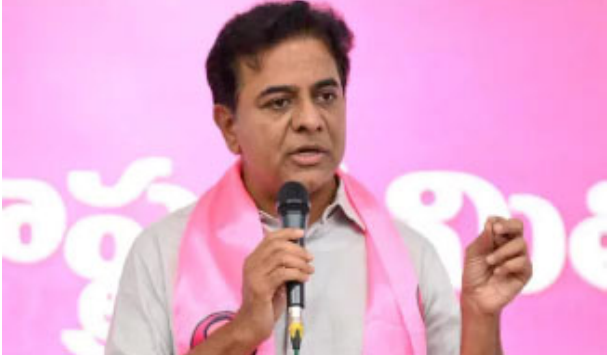
హైదరాబాద్: సికింద్రాబాద్ కార్పొరేషన్ కోసం బీఆర్ఎస్ ర్యాలీకి సిద్ధమైంది. సికింద్రాబాద్ మున్సిపల్ కార్పొరేషన్ ఏర్పాటు

చేయాలని డిమాండ్ చేస్తూ.. మాజీ మంత్రి తలసాని ఆధ్వర్యంలో సికింద్రాబాద్ రైల్వే స్టేషన్ నుంచి ఎంజీ రోడ్లోని మహాత్మాగాంధీ విగ్రహం వరకు భారీ సాంఘిక ర్యాలీకి నేతలు బయలుదేరారు. అయితే.. తమను పోలీసులు అడ్డుకున్నారు మాజీ మంత్రి కేటీఆర్ అన్నారు. "జంట నగరాల అస్తిత్వం దెబ్బతీస్తే ఉపేక్షించం. ప్రజల దీవెనలతో బీఆర్ఎస్ మళ్లీ అధికారంలోకి వస్తుంది. రేవంత్ రెడ్డి ప్రభుత్వం.. తుగ్గక పనులు చేస్తోంది" అని కేటీఆర్ అన్నారు. కోర్టు నుంచి అనుమతి తీసుకుని మళ్లీ ర్యాలీ నిర్వహిస్తామని ఆ పార్టీ నేత తలసాని అన్నారు. తాము నిర్వహిస్తున్నది సాంఘికయతమైన ర్యాలీ అని.. అందరినీ ఆహ్వానించినట్లు తెలిపారు. ర్యాలీని అడ్డుకోవడం ప్రభుత్వానికి మంచిది కాదని మండిపడ్డారు.