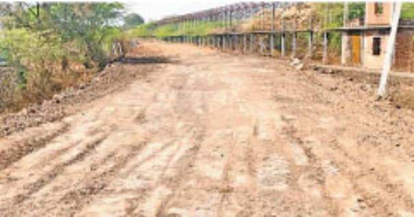
మీటర్ పొడవు ఉన్న కట్టను చదును చేశారు.