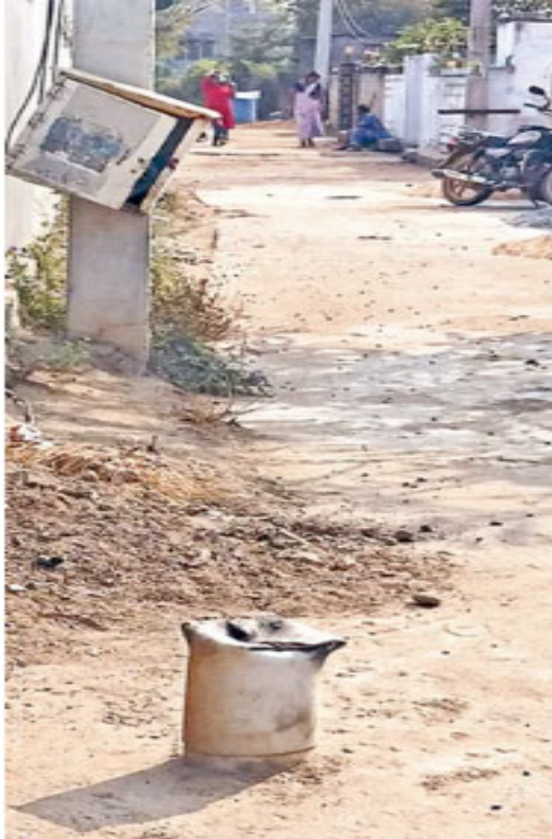
సూర్యాపేట : మోటారు లేకుండా వృధాగా కనిపిస్తున్న ఈ బోరు సూతకనలే మండలంలోని ఓ గ్రామంలోనిది. మిషన్ భగీరథ సీనియర్ సభ్యులు రావూర్లోనే ఆలోచనతో వినియోగంలోని లేని బోర్డును, బావులను అందుబాటులోకి తీసుకొస్తున్నారు. ఈ క్రమంలో దాదాపు మూడు విద్యుత్తు మోటార్లు పంచాయతీలో కనిపించకపోవడంతో