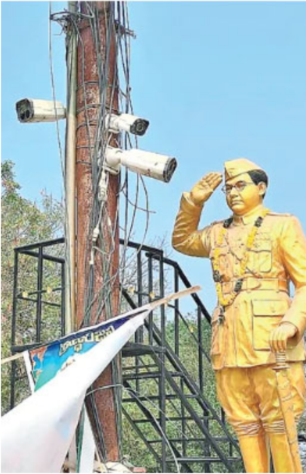
అత్యుత్సాహ : ఒక సీసీ కెమెరా వంద మంది పోలీసులతో సమానం.. పోలీసు అధికారులు తరచూ చెప్పే మాట ఇది. అనేక కేసుల ఛేదనలో కీలకంగా మారతాయి. అత్యుత్సాహ(ఎం) మండలంలో 23 గ్రామ పంచాయతీలు ఉండగా.. మండల కేంద్రంతో పాటు ప్రధాన గ్రామాల్లో 2018లో దాతల సాయంతో సుమారు 125 సీసీ కెమెరాలు ఏర్పాటు చేశారు. 25 పని చేస్తుండగా, మిగతావి అలంకార ప్రాయంగా మారాయి. పోలీసు శాఖ మరో 104 సీసీ కెమెరాలను నేను సైతం కింద అమర్చగా ఇవి కూడా పనిచేయడం లేదు. గత ఏడాది మండల కేంద్రంలో ప్రధాన రహదారిపై ఉన్న కిరాణి, బైక్ మెకానిక్, వైస్, రాంసగర్లోని కిరాణి దుకాణంలో చోరింబం జరిగింది. సీసీ కెమెరాలు పనిచేయకపోవడంతో దొంగలను పోలీసులు గుర్తించలేక పోయారు. గ్రామాల్లో సీసీ కెమెరాల ఏర్పాటు అవశ్యకతపై