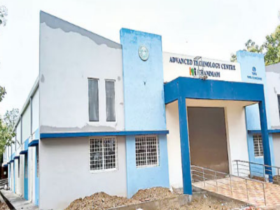
న, డ్రైన్ ఆపరేటర్ లాంటి కోర్సులకు ఎక్కువ డిమాండ్ ఉంది.

ఖమ్మం : ఏటీసీ(బడిబ)లను బలోపేతం చేసేందుకు ప్రభుత్వం వివిధ రకాల కోర్సులను ప్రవేశపెడుతోంది. పారిశ్రామిక అవసరాలు తీర్చడానికి మార్కెట్లో డిమాండ్ ఎక్కువగా ఉన్న కోర్సులను ఎంపిక చేసి నిరుద్యోగులకు శిక్షణ ఇవ్వాలని నిర్ణయించింది. ఇలాంటి పలు రకాల కోర్సులకు అర్హుల నుంచి ఖమ్మం నగరం టేకులపల్లిలోని ప్రభుత్వ బడిబ కళాశాల దరఖాస్తులు ఆహ్వానిస్తోంది. తద్వారా యువ తకు ఉపాధి, ఉద్యోగావకాశాలు కల్పించాలని సర్కారు భావిస్తోంది. కేవలం పదోతరగతి అర్హతపైనే ఈకోర్సులు చదువుకునే అవకాశముంది. ఎలాంటి వయోపరిమితి లేకపోవటం విశేషం. నైపుణ్య శిక్షణ ద్వారా సొంతంగా యూనిట్లు నెలకొల్పవచ్చు లేదా ప్రైవేటుగా ఉద్యోగాలు చేసుకోవచ్చు. ప్రస్తుతం మార్కెట్లో టర్నర్, సోలార్ టెక్నిషియన్