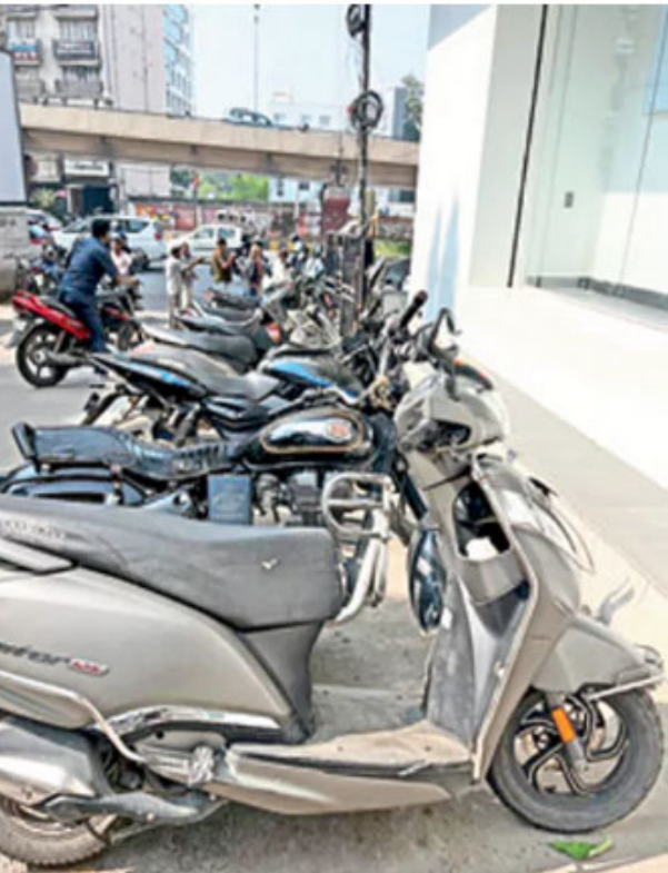
హైదరాబాద్ : జీహెచ్ఎంసీ అధికారుల ఉదాసీనత కొన్ని వ్యాపార కేంద్రాలకు అదనపు ఆదాయ వనరుగా మారింది. పార్కింగ్ ఉచితమైన.. నగర ప్రజలను దోచేస్తున్నాయి. రూ.కోట్ల దండా

జరుగుతున్నా ఆహూతి తెలుసుకునే ప్రయత్నం కనిపించడం లేదు. ఇవీ షరతులు: రాష్ట్ర ప్రభుత్వం ఏప్రిల్ 1, 2018న నగరంలో ఉచిత పార్కింగ్ విధానాన్ని అమల్లోకి తీసుకొచ్చింది. దీనికి కొన్ని షరతులు ఉన్నాయి. షాపింగ్ మాల్, కమర్షియల్ కాంప్లెక్స్, మల్టీప్లెక్స్, ఇతర వ్యాపార కేంద్రాలకు వినయోగదారు వాహనంతో వెళ్లినప్పుడు.. తన వాహనాన్ని అరగంటపాటు ఉచితంగా పార్కింగ్ చేసుకోవచ్చు. ఏదేనీ వస్తువును కొనుగోలు చేస్తే గంట వరకు.. గంటకుపైగా వాహనాన్ని నిలిపితే మాత్రం.. కొనుగోలు చేసిన వస్తువు విలువ.. పార్కింగ్ సమయానికి విధించే రుసుముకన్నా అధికంగా ఉండాలి. ఫీజు కడితే లోపలికి.. టేగంపేట్ మెట్రోస్టేషన్ వద్ద మైసూం టైకాన్, వైట్ హోజ్ అనే వాణిజ్య కేంద్రాలన్నాయి. వాటిలో వదుల కొద్దీ షాపింగ్ కేంద్రాలు ఉన్నాయి. కార్లు, ద్విచక్ర వాహనాలతో రోజూ వేయి మందికిపైగా సందర్శిస్తారు. లోపలికి ప్రవేశించగానే పార్కింగ్ తాత్కాలిక రసీదు చేతిలో పెట్టి, కారుకు రూ.50, ద్విచక్ర వాహనానికి రూ.20 చొప్పున వసూలు చేస్తున్నారు. మైత్రివనం ఛౌరస్తాలోని ఆడిట్ ఎన్ కేమ్, అబిడ్స్, కోట్, పంజాగుట్ట, దిల్ సుఖ్ నగర్ లోని వాణిజ్య కేంద్రాల్లోనూ ఈ దండా జరుగుతోంది. వీక్షేం చేస్తున్నారో.. జీహెచ్ఎంసీలో గతంలో ఈపిడిఎం(ఎన్ఎఫ్ఆర్ఎంఎంట్, విజిటెన్స్, డిజిజిఎంట్ మేనేజ్మెంట్) విభాగం ఉండేది. దానిని హైద్రాగా మార్చారు. ఆ బాధ్యతను నిర్వహించాల్సిన జీహెచ్ఎంసీ అధికారులు.. తమకు సంబంధమేలేనట్లు వ్యవహరిస్తున్నారు.