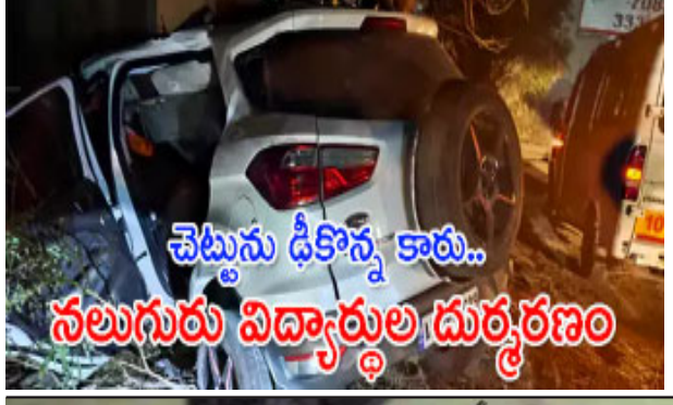
చెట్టును డీకొన్న కారు... నలుగురు విద్యార్థుల దుర్మరణం