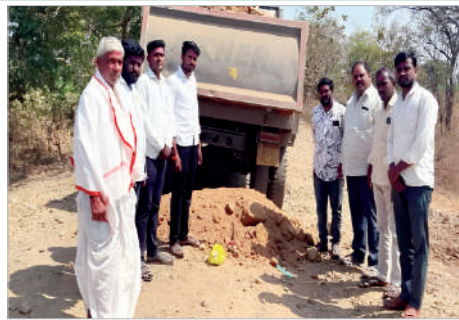
సర్పంచ్, పలువురు కాంగ్రెస్ నాయకులు పాల్గొన్నారు.