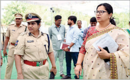
నిర్మల్, ఫిబ్రవరి 11 (ప్రభాత సమాచారం)

నిర్మల్ జిల్లాలో బుధవారం జరిగిన మున్సిపల్ ఎన్నికల పోలింగ్ పకడ్బందీ ఏర్పాట్ల మధ్య ప్రశాంతంగా ముగిసింది. ఉదయం 7 గంటల నుంచి సాయంత్రం ఐదు గంటల వరకు బైసా నిర్మల్ ఖానాపూర్ మున్సిపాలిటీ పరిధిలోని 80 వార్డులకు 2004 పోలింగ్ కేంద్రాల్లో ప్రజలు తమ ఓటు హక్కును వినియోగించుకున్నారు. ఉదయం మందకోడిగా ప్రారంభమైన ఎన్నికల పోలింగ్ మధ్యాహ్నం ఊపందుకుంది. అయితే పట్టణంలో పోలింగ్ కేంద్రాల వద్ద జనం లేకపోవడంతో ఓటర్లు ఇలా వచ్చి అలా ఓట్లు వేసి సంతోషం వ్యక్తం చేశారు. ఖానాపూర్ పట్టణంలో ఓ వార్డులో కొందరు ఓటర్లు రెండుసార్లు ఓట్లు వేశారని పోలీసులపై టిఆర్ఎస్ కాంగ్రెస్ నేతలు మండిపడ్డారు. సమస్య అత్యుక్త పోలింగ్ కేంద్రాల వద్ద పోలీస్ బందోబస్తు ఏర్పాట్లు చేశారు. ఎన్నికలకు ప్రతి ఒక్కరు సహకారం: కలెక్టర్