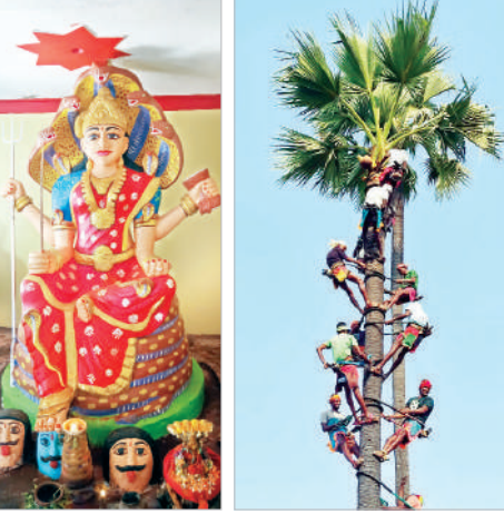
జన్నారం, ఫిబ్రవరి 11 (ప్రభాత సమాచారం) జన్నారం మండల కేంద్రంలో ఘనంగా ఎల్లమ్మ బోనాలు

నిర్వహించారు. గత ఐదు రోజులుగా జన్నారం గ్రామంలో గౌడ కులస్తుల ఆరాధ్య దైవంగా భావించే రేణుక ఎల్లమ్మతల్లి బోనాలు నేటితో ముగిశాయి. మంగళవారం రాత్రి మహిళలు ఇంటికొక బోనం చొప్పున నెత్తిన పెట్టుకుని బోనాలను తీసుకొని వెళ్లి ఎల్లమ్మకు సమర్పించారు. తమను సల్లంగా చూడు తల్లి అని బోనం సమర్పించుకున్నారు బుధవారం బైండ్ల కులస్తుల చేత పట్నాలు వేసి మేకపిల్లను గావు పట్టారు. ఐదు రోజులు జరుగుతున్న బోనాల పండగకు గౌడ కులస్తులే కాకుండా అన్ని వర్గాల ప్రజలు పెద్ద ఎత్తున పాల్గొని పూజలు చేసి అమ్మవారికి మొక్కులు చెల్లించుకున్నారు బుధవారం ఆలయ సమీపంలోని తాటి చెట్టును 13 మంది గీతా కార్మికులు ఎక్కి చెట్టు నుండి ఒకరి నుంచి ఒకరు కట్టు కుండా ను తీసి అమ్మవారికి సమర్పించారు 13 మంది గీత కార్మికులు ఒకేసారి చెట్టు ఎక్కి ఒకరి నుంచి మరొకరు కళ్ళు కిందకు దించడం చూసే వారిని అభివ్రంబించి కార్యక్రమం అంతా కన్నుల పండగ నిర్వహించిన గౌడ కులస్తులకు అభినందనలు తెలిపారు.