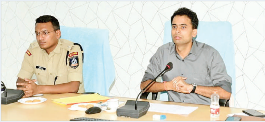
ఆదిలాబాద్, ఫిబ్రవరి 14 (ప్రభాత సమాచారం)