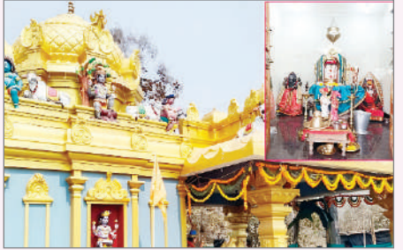
జాతర సందర్భంగా దేవాలయ కమిటీ వారు ఇప్పటికే విస్తృత ఏర్పాట్లు చేశారు. అలాగే టీజీవీఎన్ఆర్డీసీ వారు జాతర సందర్భంగా ఆసిఫాబాద్ డిపో నుంచి భక్తుల సౌకర్యార్థం ప్రత్యేక బస్సులు ఏర్పాటు చేశారు.