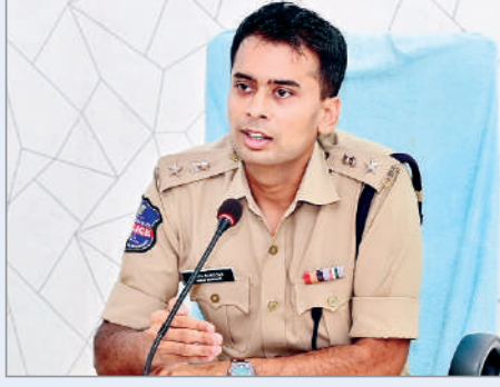
జిల్లా ఐపిఓ ద్వారా ఇన్వెస్టిగేట్ ప్రాడ్స్ చేస్తుంటారని, నిరుద్యోగులకు ఉద్యోగ అవకాశాలు కల్పిస్తామని ఫీజులు చెల్లించ