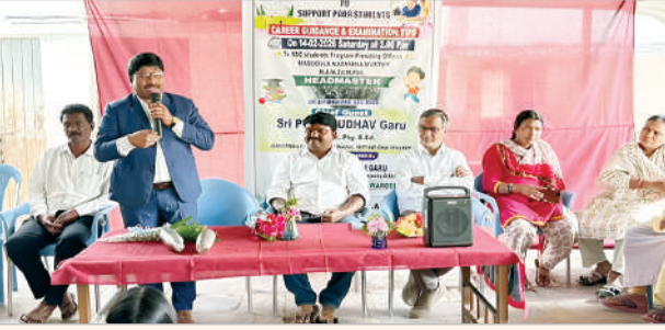
వాంకిడి, ఫిబ్రవరి 14 (ప్రభాత సమాచారం)