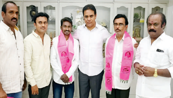
బెల్లంపల్లి, ఫిబ్రవరి 14 (ప్రభాత సమాచారం) బెల్లంపల్లి మునిసిపల్ రాజకీయాలు శరవేగంగా మారుతున్నాయి. ఎప్పుడెమి జరుగుతుందో చెప్పలేని పరిస్థితి నెలకొంది. కాంగ్రెస్ క్యాంపు నుంచి 26 వార్డు కౌన్సిలర్ ఇప్పుడు మార్చి స్వామి బయటికి వచ్చినట్లు తెలుస్తోంది. 30వ వార్డు నుంచి గెలుపొందిన