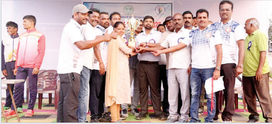
మంచిర్యాల, ఫిబ్రవరి 14 (ప్రభాత సమాచారం)

క్రీడల ద్వారా నాయకత్వ లక్షణాలు అలవాదతాయని జిల్లా కలెక్టర్ కుమార్ దీపక్ అన్నారు. శనివారం జిల్లా కేంద్రం లోని జిల్లా పరిషత్ బాలుర ఉన్నత పాఠశాల మైదానంలో కొనసాగుతున్న సిఎం కమ్ 2025 పోటీలకు జిల్లా యువజన క్రీడా సేవల అధికారి గుర్రాల హనుమంత రెడ్డి, జిల్లా మైనారిటీ సంక్షేమ శాఖ అధికారి నీరటి రాజేశ్వరి అధికారులు, క్రీడాకారులతో కలిసి హాజరయ్యారు. ఈ సందర్భంగా జిల్లా కలెక్టర్ మాట్లాడుతూ గ్రామీణ స్థాయి నుండి యువతలో దాగి ఉన్న క్రీడా నైపుణ్యతను వెలికి తీసేందుకు ప్రభుత్వం సిఎం కమ్ క్రీడా పోటీలను నిర్వహిస్తుందని తెలిపారు. క్రీడల