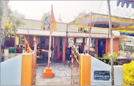
లోకేశ్వరం, ఫిబ్రవరి 14 (ప్రభాత సమాచారం)

పిలిస్తే పలికే ప్రతిరూపంగా బ్రహ్మేశ్వర ఆలయం భక్తుల పాలిట కొంగుబంగారం విరాజిల్లుతున్నది. శివనామస్మరణ తో బ్రహ్మేశ్వరాన్ని పూజిస్తే కోరుకున్న కోరికలన్నీ నెరవేరుతాయని ఇక్కడి భక్తుల విశ్వాసం. కొన్నేళ్ల క్రితం మండలంలోని గోదావరి ఒడ్డున వెలిసిన బ్రహ్మేశ్వర ఆలయం దినదినాభివృద్ధి చెందుతున్నది. బ్రహ్మేశ్వరాలయం నిత్య పూజలతో వెలుగొందుతున్నది. ఇక్కడికి జిల్లా నుంచే కాకుండా మహారాష్ట్ర, నిజామాబాద్ తదితర ప్రాంతాల నుంచి సైతం భక్తులు వస్తుంటారు. శివరాత్రి రోజున గోదావరిలో స్నానమాచరించి ప్రత్యేక పూజలు చేస్తుంటారు.