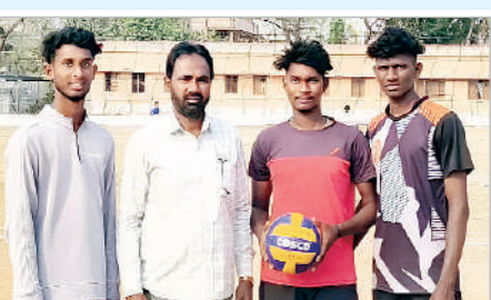
కాసిపేట, ఫిబ్రవరి 14 (ప్రభాత సమాచారం)