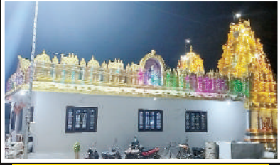
మహాశివరాత్రి ఉత్సవాలకు ముస్తాబైన ఉమ్మడి జిల్లాలోని ప్రాచీన శైవ క్షేత్రాలు