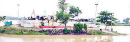
మహిమాన్విత సిరిచెల్ల శివాలయం