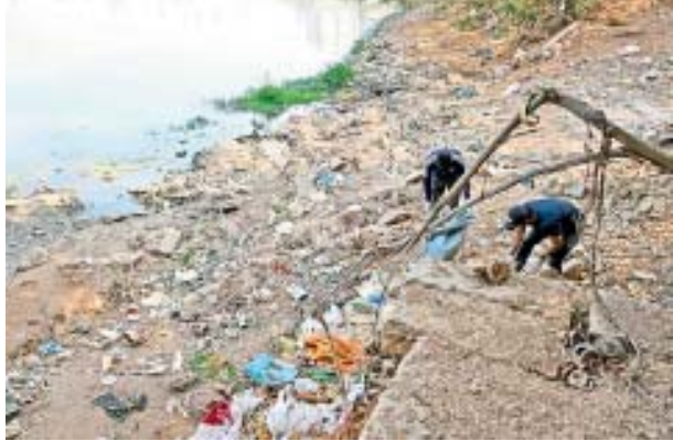
నగరంలో పరిస్థితి ఇది...

హైదరాబాద్ : భూతలా ప్లాస్టిక్ పర్యావరణాన్ని ధ్వంసం చేస్తోంది. నిషేధాజ్ఞలున్నా విచ్చలవిడిగా వినియోగం పెరుగుతోంది. ఉత్పత్తి లేకుండా చేయడంలో అధికార యంత్రాంగాలు విఫలమవుతున్నాయి. గ్రేటర్లో రోజూ 8వేల టన్నుల చెత్త పోగవుతుండగా అందులో 14శాతం ప్లాస్టిక్ వ్యర్థాలే. ప్లాస్టిక్ రహితసంగరంగా మార్చాలంటే 'సిక్కిం' తరహా కఠిన విధానాలు అవలంబించాలని నిపుణులు సూచిస్తున్నారు. అక్కడ ఇలా..: పర్యావరణ పరిరక్షణలో దేశంలోనే ముందున్న రాష్ట్రం సిక్కిం. ప్లాస్టిక్ వ్యర్థాలు భారీవర్షాల సమయంలో డ్రైన్లను అడ్డుకోవడం తో అక్కడ కొండనరాలు విరిగిపడి అనేకమంది మరణించారు. ఈ నేపథ్యంలోనే 1998లో తొలిసారిగా డిస్పోజబుల్ ప్లాస్టిక్ క్యారీ బ్యాగ్లు (50 మైక్రాన్ల కంటే తక్కువ ఉన్నవి) నిషేధించింది. 2016లో ధర్మకోల్ షేట్లు, డిస్పోజబుల్ ఉత్పత్తులపై పూర్తి నిషేధం అమలు చేసింది. ప్రభుత్వ కార్యాలయాలు, కార్యక్రమాల్లో ప్లాస్టిక్ డ్రింకింగ్ నీటిని నిషేధించడంతో పాటు 2022 జనవరి నుంచి 2 లీటర్లు అంతకంటే తక్కువ సామర్థ్యం ఉన్న ప్లాస్టిక్ నీటిసీసాల తయారీ, దిగుమతి, అమ్మకం, వినియోగంపై అంక్షలు విధించింది. 2022 డిసెంబరు 31నుంచి 120 మైక్రాన్లకంటే తక్కువ మందం ఉన్న ప్లాస్టిక్ క్యారీ బ్యాగ్లను నిషేధించి విధించింది. ప్రకటనలే పరిమితం చేయకుండా మున్సిపల్ స్టాండ్లు, కాలుష్య నియంత్రణ మండలి బృందాలు నిరంతరం తనిఖీలుచేస్తున్నాయి. ఉల్లంఘించిన వారిపై జరిమానా విధిస్తున్నారు. పాఠశాలల్లో అవగాహన కార్యక్రమాలతో చిన్నారులకు, స్వచ్ఛంద సంస్థల సహకారంతో ప్రజల్లో అవగాహన కల్పిస్తున్నారు.