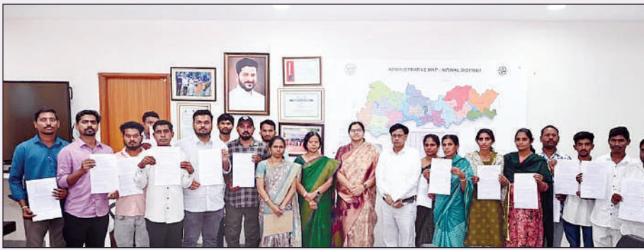
నిర్మల్, మార్చి 2 (ప్రభాత సమాచారం) కారుణ్య నియామకాలు పొందిన ఉద్యోగులందరూ క్రమ శిక్షణతో తమ విధులను సమర్థవంతంగా నిర్వహించాలని జిల్లా కలెక్టర్ అభిలాష అభినవ్ సూచించారు. సోమవారం సాయంత్రం కలెక్టరేట్‌లోని తన చాంబర్‌లో కారుణ్య నియామకాలు పొందిన 18 మంది అభ్యర్థులకు నియామక