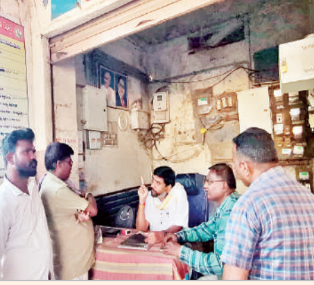
ఇప్పటివరకు కనీస మరమ్మత్తులు, అదనపు వసతులు కల్పించలేదని అసంతృప్తి వ్యక్తం చేశారు. సమస్యను తక్షణమే పరిష్కరించేందుకు అడ్మినిస్ట్రేటివ్ అధికారులను మందలించారు.

కాగజేనగర్, మార్చి 2 (ప్రభాత సమాచారం) కాగజేనగర్ పట్టణంలోని బస్టాండ్లో కనీస సౌకర్యాలు లేవన్న ఆరోపణల నేపథ్యంలో సోమవారం ఎమ్మెల్యే డా.పాల్వాయి హరివేణు అడ్మినిస్ట్రేటివ్ డిపో మేనేజర్ రాజశేఖర్ తో కలిసి బస్టాండ్, పరిసరాలను తనిఖీ చేశారు. ఈ సందర్భంగా దుర్గంధం వెదజల్లుతున్న పరిసరాలు, టాయిలెట్లు, పారిశుధ్యం లేని బస్టాండ్ ఆవరణను పరిశీలించిన ఎమ్మెల్యే అడ్మినిస్ట్రేటివ్ అధికారులను మందలించారు. వెంటనే పారిశుధ్య పనులు చేపట్టాలని ఆదేశించారు. బస్టాండ్ అభివృద్ధికి అవసరమైన ప్రతిపాదనలు సిద్ధం చేసి అందజేస్తే నిధులు మంజూరుకు కృషి చేస్తామని తెలిపారు. స్వర్ణీయ పాల్వాయి పురపాలకం రావు ఎమ్మెల్యేగా ఉన్న సమయంలో నిర్మించిన ఈ బస్టాండ్