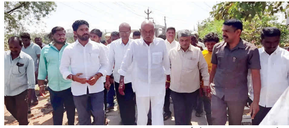
అభివృద్ధి, సౌకర్యాలను కల్పించడానికి కార్యక్రమాన్ని ప్రభు మధుకర్, డిప్యూటీ మేయర్ సల్లా రమ్య, 30 కార్పొరేటర్ శ్రీనివాస్, మున్సిపల్ కమిషనర్ అన్నేష్తో పాల్గొన్నారు.

మంచినాళ, మార్చి 7 (ప్రభాత సమాచారం) ప్రజా పాలన-ప్రగతి ప్రణాళిక 99 రోజుల కార్యచరణ ప్రణాళికలో భాగంగా కార్పొరేషన్ పరిధిలోని 30వ డివిజన్లోని కట్టకొమ్ము గుడిసెల ప్రాంతంలో శనివారం ఎమ్మెల్యే కొత్తూరి ప్రసాద్ కార్యక్రమం కలిపి అధికారులను ఆదేశించారు. కాలనీలోని సమస్యలను విని పరిష్కరించాలని అధికారులను ఆదేశించారు. ఈ సందర్భంగా డివిజన్ వాసులు పలు సమస్యలను ఎమ్మెల్యేకు విన్నవించారు. ఊరు శ్రీరాంపూర్ వద్ద బస్సులు ఆపకపోవడం వలన ఇబ్బందులు పడుతున్నాయని, ఎక్కువ సమయం మంచినీటి సరఫరా చేయాలని, విద్యుత్ వైర్లు కిందకు వేలాడుతున్నాయని, వీధి లైట్లు వెలగడంలేదని, కొత్తవి ఏర్పాటు చేయాలని ఎమ్మెల్యే దృష్టికి తీసుకెళ్లారు. ప్రజలు చెప్పిన సమస్యలను విన్న ఎమ్మెల్యే సంబంధిత అధికారులతో ఫోన్లో మాట్లాడి సమస్యలు పరిష్కరించాలని ఆదేశించారు. అన్ని డివిజన్