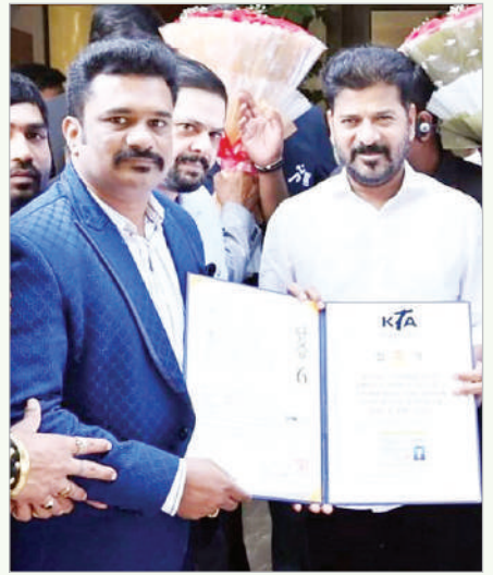
తెలంగాణ టైక్వాండో అంతర్జాతీయ యువనికపై త్రిపట్ల పతాకాన్ని సగర్వంగా ఎగురవేయాలని ఆశిద్దాం.