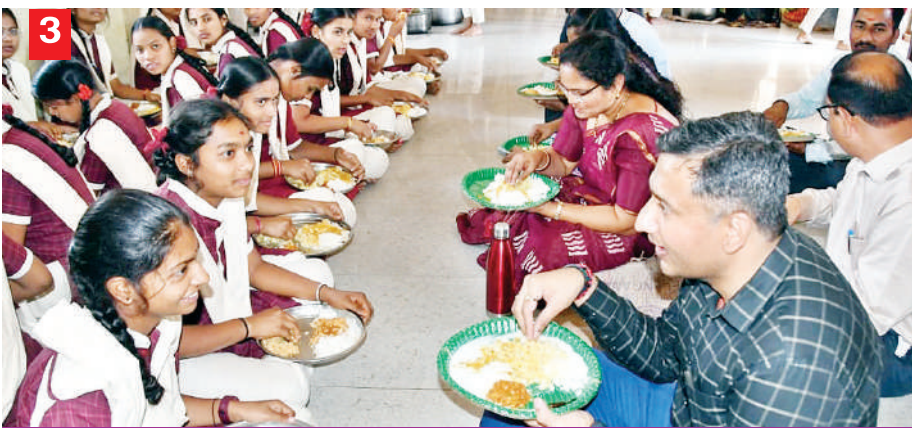
విద్యార్థులు ఆరోగ్యంపై ప్రత్యేక శ్రద్ధ వహించాలి