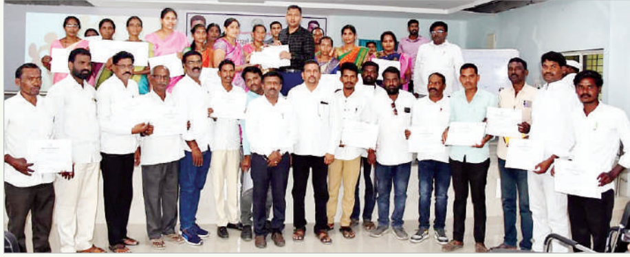
ఆదిలాబాద్, మార్చి 7 (ప్రభాత సమాచారం)