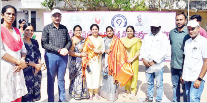
ఆదిలాబాద్, మార్చి 7 (ప్రభాత సమాచారం) రాష్ట్ర ప్రభుత్వ ఆదేశాల మేరకు 99 రోజుల 'ప్రజాపాలన - ప్రగతి ప్రణాళిక'లో భాగంగా మహిళా దినోత్సవ వేడుకలను