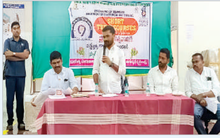
ఉట్నూర్లో చేరి స్థిరపడాలన్నారు. అక్కడి నుండి లక్కారం ప్రభుత్వ పాఠశాలలో పదవ తరగతి విద్యార్థులకు ప్యాస్స్ ,

ఉట్నూర్, మార్చి 9 (ప్రభాత సమాచారం) విద్యార్థులు విద్యతో పాటుగా నైపుణ్యాల కలిగిన కోర్సులను నేర్చుకోవడంతో ఉపాధి అవకాశాలు త్వరగా లభిస్తాయని ఖాసాపూర్ ఎమ్మెల్యే వెడ్డ బొజ్జ పటేల్ అన్నారు. ఉట్నూర్ మండల కేంద్రంలోని ఏటీసీలో విద్యార్థులతో ఇంటరాక్షన్ ప్రోగ్రామ్ లో ఎమ్మెల్యే పాల్గొని నూతన కోర్సులను ప్రారంభించారు. విద్యార్థులు చేసిన అసైన్మెంట్ ను తిలకించారు. ఎమ్మెల్యే మాట్లాడుతూ.. విద్యార్థులకు నాణ్యమైన విద్యను అందించడమే ప్రభుత్వ లక్ష్యమన్నారు. ఇందులో భాగంగానే విద్యార్థులకు ఉపాధి అవకాశాల కోసం ఎటీసీలను ఏర్పాటు చేసిందన్నారు. ఈ కోర్సులలో రాజీంచి