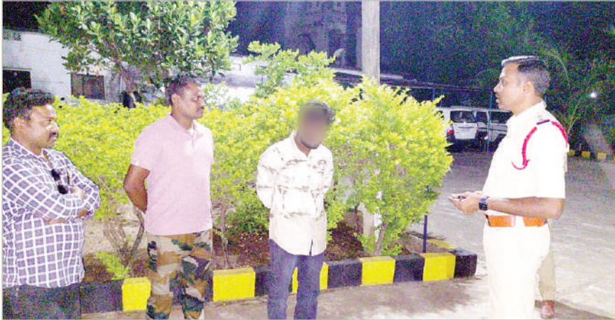
జిల్లా పోలీసులు ఆధ్వర్యంలో పోలీసు హెడ్ క్వార్టర్ లో నిర్వహించున్న జాబ్ మేళా నందు పాల్గొని తనకు నచ్చిన ఉద్యోగాన్ని చేయవలసిందిగా సూచించారు. దానికి కావలసిన డాక్యుమెంట్లను అందిస్తానని హామీ ఇచ్చారు. ప్రాణ నష్టం కాకుండా కాపాడిన పోలీసులకు గ్రామస్థులు తల్లిదండ్రులు కృతజ్ఞతలు తెలియజేశారు. ఈ విషయం తెలుసుకున్న జిల్లా పోలీసు అధికారి ప్రత్యేకంగా సిబ్బందిని అభినందించారు.