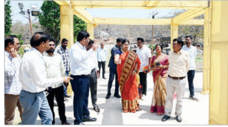
మాట్లాడుతూ, మున్సిపాలిటీలవారిగా కౌన్సిలర్లకు, మండలాల వారిగా సర్పంచ్ లకు సీటింగ్ ఏర్పాటు చేయాలన్నారు. కార్యక్రమాన్ని నిర్దిత సమయానికి ప్రారంభించి, సాఫీగా