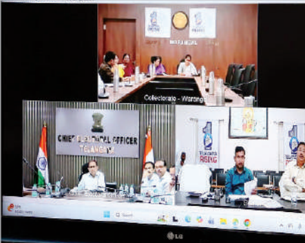
రాజకీయ పార్టీల ప్రతినిధులతో ప్రత్యేక సమావేశం నిర్వహించనున్నట్లు వెల్లడించారు. జిల్లాలోని 595 పోలింగ్