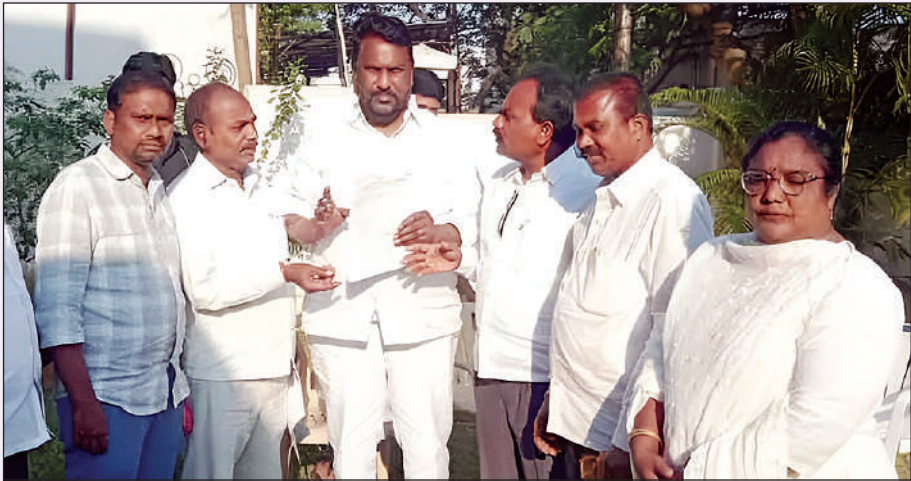
ఉట్నూర్, మార్చి 13 (ప్రభాత సమాచారం) సమస్యలను పరిష్కరించాలని ఏజెన్సీ షెడ్యూల్డ్ కులాల ఏజెన్సీ ప్రాంతంలో నివాసంలో దళితులు ఎదుర్కొంటున్న జాయింట్ యాక్షన్ కమిటీ నాయకులు అన్నారు. ఈ