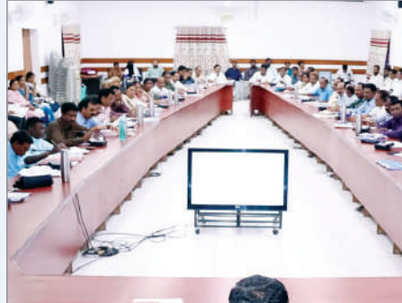
ఓఆర్ఎస్ ప్యాకెట్లు, ప్రాథమిక చికిత్స కిట్లు అందుబాటులో ఉంచాలని వైద్య ఆరోగ్య శాఖ అధికారులను, విద్యార్థులు

పకడ్బందీగా నిర్వహించాలని కలెక్టర్ ఆదేశం - నేటి నుంచి టెన్ పరీక్షలు నిబంధనలు అతిక్రమిస్తే చర్యలు - పారదర్శకంగా పదవ తరగతి పరీక్షలు - సీసీ కెమెరాల నిఘాలో కేంద్రాలు టెన్ స్టూడెంట్స్ కు గుడ్ న్యూస్ - హాల్ టికెట్ చూపిస్తే ఆర్టిసి బస్సుల్లో ఉచిత ప్రయాణం