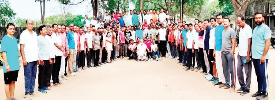
నిర్మల్, మార్చి 15 (ప్రభాత సమాచారం) మార్నింగ్ వాక్ దీర్ఘకాలిక వాడుకనుంచి రక్షణ కల్పించడమే