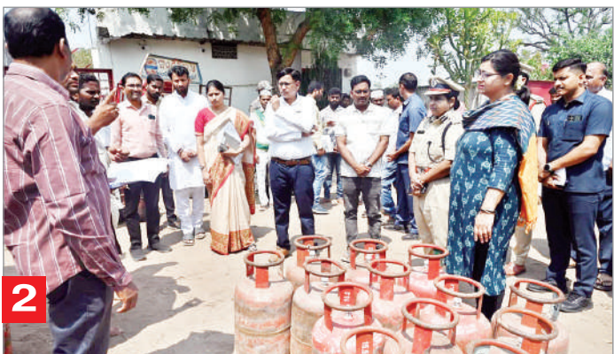
జిల్లాలో గ్యాస్ సిలిండర్ల కొరత లేదు