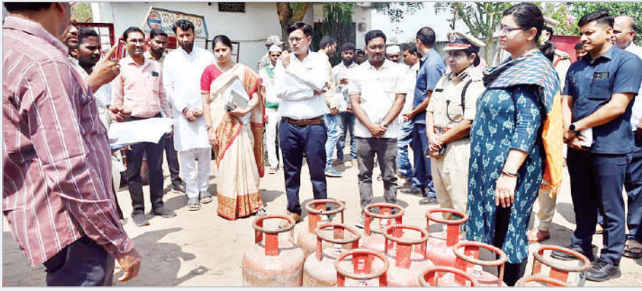
సారంగాపూర్, మార్చి 17