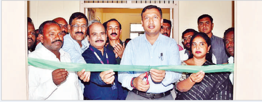
తలమడుగు, మార్చి 17 (ప్రభాత సమాచారం)