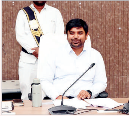
ప్రత్యేక సమగ్ర సవరణ కార్యక్రమం ద్వారా 2002 ఓటర్ జాబితాకు 2025 ఓటర్ల జాబితాను మ్యూపింగ్ చేసి ఎలాంటి పొరపాట్లు లేని ఓటరు జాబితా సిద్ధం చేయడం