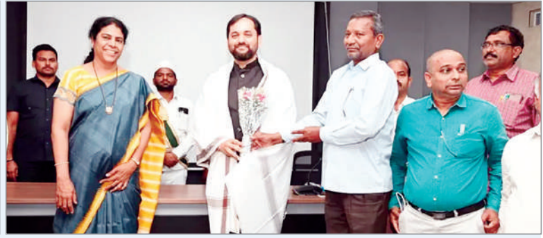
విద్యాధికారిగా పని చేసిన కాలంలో అధికారుల సహాయ సహకారాలు లభించాయని చెప్పారు. అధికారుల సమన్వయంతో శాసన సభ, పార్లమెంట్, సర్పంచ్, మున్సిపల్ ఎన్నికలు ప్రశాంతంగా జరిగి చర్యలు తీసుకున్నారని తెలిపారు.