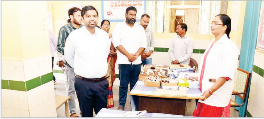
మంచిర్యాల, మార్చి 17 (ప్రభాత సమాచారం)