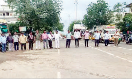
పట్టించుకోవడం లేదని ఆరోపించారు. ఇప్పటికైనా అధికారులు స్పందించి వెంటనే రోడ్డు పనులు చేపట్టాలని డిమాండ్ చేశారు.

ఆసిఫాబాద్, మార్చి 18 (ప్రభాత సమాచారం) తమ గ్రామానికి రోడ్డు వేయాలని డిమాండ్ చేస్తూ బుధవారం ఆసిఫాబాద్ పట్టణంలోని సాయిబాబా ఆలయం సమీపంలోని గుండి గ్రామస్థులు రోడ్లెక్కి ధర్మా చేపట్టారు. గ్రామానికి వెళ్ళి లింకేజీ రోడ్డు దయనియంగా తయారైందని ఆగ్రహం వ్యక్తం చేశారు. కంకర తేలి పూర్తిగా గుంతల మాయమై రోడ్డుపై ప్రయాణం సరకప్రాయంగా మారిందని ఆవేదన వ్యక్తం చేశారు. వర్షాకాలంలో బురద కారణంగా వాహనాలు నడపడం ప్రాణానంతరంగా మారిందని వాపోయారు. గతంలో ఈ గుంతల్లో పడి అనేక మంది వాహనదారులు గాయాలపాలైనట్లు.. రోడ్డు నిర్మాణ విషయంలో పలుమార్లు పాలకుల దృష్టికి తీసుకెళ్లిన ఎవరు