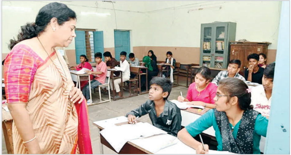
బృందాలు ప్రతి పరీక్ష కేంద్రానికి సిటింగ్ స్కూల్స్ బృందాలు, విధులు నిర్వహిస్తున్నారని అన్నారు. విద్యార్థులు ఎలాంటి ఒత్తిడులకు లోనుకాకుండా ప్రశాంత వాతావరణంలో పరీక్షలు రాసేలా చర్యలు తీసుకుంటున్నట్లు తెలిపారు.

ఆసిఫాబాద్, మార్చి 18 (ప్రభాత సమాచారం) పదవ తరగతి వార్షిక పరీక్షలను ఎలాంటి అవాంఛనీయ సంఘటనలు జరుగకుండా ప్రశాంతంగా నిర్వహించాలని కలెక్టర్ హరిత అన్నారు. బుధవారం జిల్లా కేంద్రంలోని జిల్లా పరిషత్ బాలికల సెకండరీ పాఠశాలలో ఏర్పాటు చేసిన పరీక్ష కేంద్రాన్ని కలెక్టర్ అకస్మిక తనిఖీ నిర్వహించి పరీక్ష తీరును పరిశీలించారు. అనంతరం కలెక్టర్ మాట్లాడుతూ... పదవ తరగతి పరీక్షలను ఎలాంటి అవాంఛనీయ సంఘటనలు జరగకుండా ప్రశాంతంగా నిర్వహించాలన్నారు. జిల్లాలో పదవ తరగతి వార్షిక పరీక్షల కొరకు 38 కేంద్రాలు ఏర్పాటు చేయడం జరిగిందని 6948 మంది విద్యార్థులు పరీక్షలు రాస్తున్నారని కలెక్టర్ పేర్కొన్నారు. పరీక్షా కేంద్రాలలో సీసీ కెమెరాలు, త్రాగు నీరు, వెలుతురు ఉండేలా చర్యలు తీసుకున్నట్లు తెలిపారు. పరీక్ష కేంద్రాల వద్ద వైద్య సిబ్బంది ఓ ఆర్ ఎస్ ప్యాకెట్లను అందుబాటులో ఉంచుతున్నారు. జిల్లాలో 2 ఫ్లయింగ్ స్కూల్స్