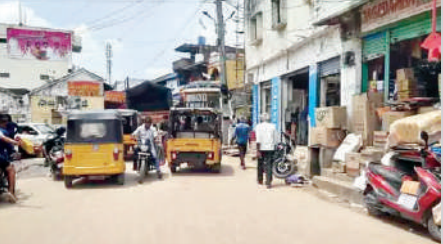
చెన్నూర్, మార్చి 19 (ప్రభాత సమాచారం)

మంచినీటి సౌకర్యం పట్టణంలోని అంబేద్కర్ చౌక్ నుంచి కోటపల్లి బస్టాండ్ చెరువు కట్ట వరకు గల రోడ్డు చిన్నదిగా ఉండడంతో పట్టణ ప్రజలు ప్రతిరోజూ ట్రాఫిక్