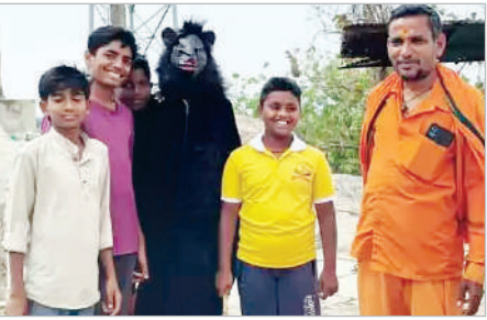
ఖానాపూర్, మార్చి 19 (ప్రభాత సమాచారం) ఖానాపూర్ మండలంలోని సూర్యాపూర్ గ్రామం లోని శ్రీ లక్ష్మీ వెంకటేశ్వర స్వామి ఆలయానికి వస్తున్న భక్తులకు,