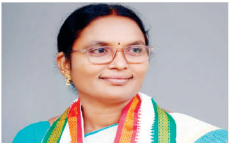
మాట్లాడుతూ కాంగ్రెస్ పార్టీ పట్ల నిబద్ధతతో పనిచేసే