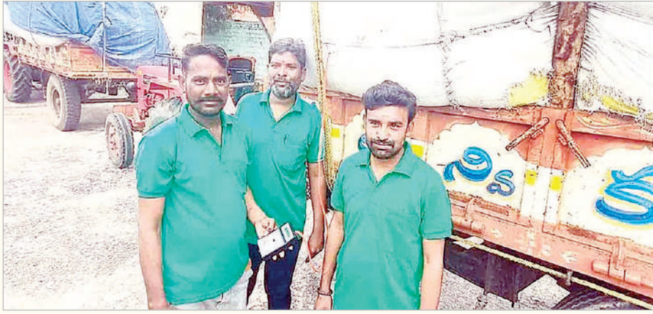
అదిలాబాద్, మార్చి 19 (ప్రభాత సమాచారం) అదిలాబాద్ జిల్లా కేంద్రంలో ఏ, బీ మార్కెట్ యార్డులు వానకాలంలో రైతులు పండించిన పత్తి పంటను మార్కెటింగ్ శాఖ అధ్యక్షులతో యార్డుల్లో కొనుగోలు చేస్తారు.