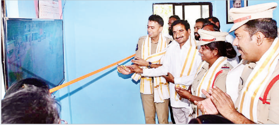
తలమడుగు, మార్చి 19 (ప్రభాత సమాచారం)