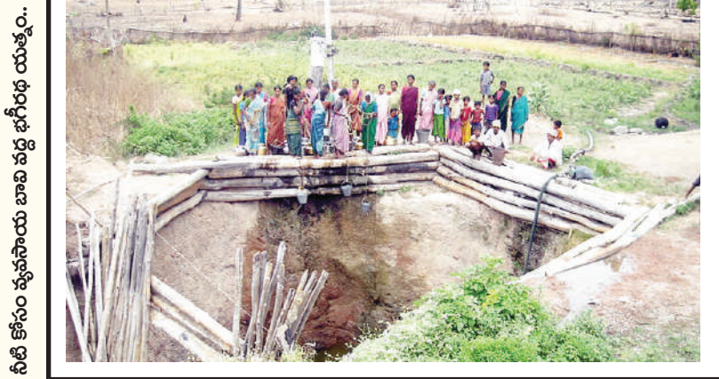
నీటి కోసం వ్యవసాయ బావి వద్ద భగీరథ యుత్వం..