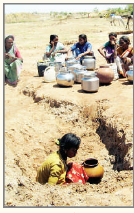
చెలిమెల నీర్ శరణ్యం..