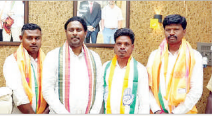
కాంగ్రెస్ పార్టీలో చేరిన