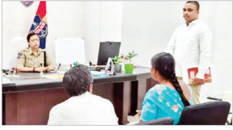
ద్వారా ప్రజా సమస్యలను స్వీకరించి పరిష్కరించేందుకు పోలీస్ శాఖ కృషి చేస్తోందని తెలిపారు.

ఆసిఫాబాద్, మార్చి 23 (ప్రభాత సమాచారం) జిల్లా పోలీస్ కార్యాలయంలో సోమవారం నిర్వహించిన ప్రజావాణి కార్యక్రమంలో జిల్లా ఎస్సీ నితికా పంత్ ప్రజల నుంచి ఫిర్యాదులు స్వీకరించారు. జిల్లాలోని వివిధ ప్రాంతాల నుంచి వచ్చిన బాధితుల సమస్యలను విని, చట్టప్రకారం త్వరగా పరిష్కరించేందుకు సంబంధిత పోలీస్ అధికారులకు సూచనలు చేశారు. ఈ సందర్భంగా మొత్తం 13 ఫిర్యాదులు స్వీకరించగా వాటి పరిష్కారానికి సంబంధిత డీఎస్సీ, ఎఎస్సీ, సర్కిల్ ఇన్స్పెక్టర్లతో ఫోన్ ద్వారా మాట్లాడి అవసరమైన మార్గ నిర్దేశం చేశారు. ప్రతి సోమవారం ప్రజావాణి కార్యక్రమం