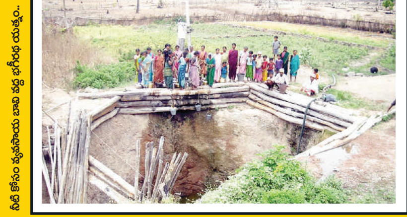
నీటి కోసం వ్యవసాయ బావి వద్ద భగీరథ యత్నం..