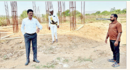
బెల్లంపల్లి, ఏప్రిల్ 2 (ప్రభాత సమాచారం)

వేసవికాలం సమీపిస్తున్నందున ప్రజలకు త్రాగునీటి సమస్యలు లేకుండా ముందస్తుగా చేపట్టిన పనులను నిర్ణీత గడువులోగా పూర్తి చేయాలని జిల్లా అదనపు కలెక్టర్ (స్థానిక సంస్థలు) పి.చంద్రయ్య అన్నారు. గురువారం జిల్లాలోని బెల్లంపల్లి మున్సిపాలిటీలో అప్పూత్ 2.0 పనుల పురోగతిని ఆకస్మికంగా