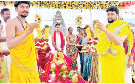
కించేందుకు భక్తులు తరలివచ్చారు. ఆలయ కమిటీ అధ్యక్ష్యంలో భక్తులకు అన్న ప్రసాదాన్ని అందించారు.