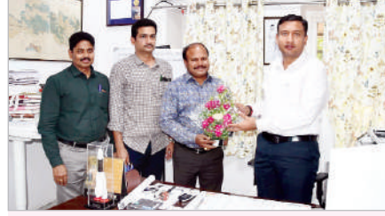
జిల్లా కలెక్టర్ను మర్యాదపూర్వకంగా కలిసిన నూతన ఆర్టీసీ ఆర్ఎం జిల్లాలో రవాణా వ్యవస్థను మరింత బలోపేతం చేయాలి ప్రజలకు మెరుగైన సేవలు అందించాలి