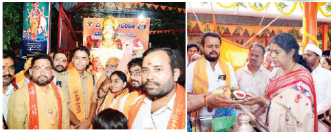
ఆసిఫాబాద్, ఏప్రిల్ 2 (ప్రభాత సమాచారం)