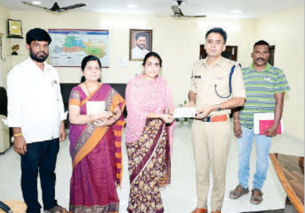
ఆదిలాబాద్, ఏప్రిల్ 2 (ప్రభాత సమాచారం) బాధిత కుటుంబానికి ఎల్లవేళలా అండబాటులో ఉంటామని జిల్లా ఎస్పీ అఖిల్ మహాజన్ ఐపిఎస్ తెలియజేశారు. ఈ