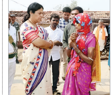
అర్చనల ప్రతి ఒక్కరికీ సంక్షేమ