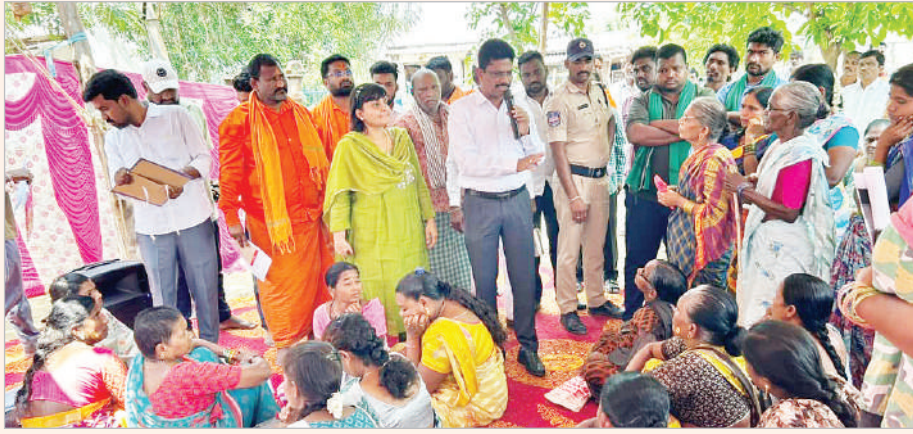
తాండూర్, ఏప్రిల్ 2 (ప్రభాత సమాచారం)