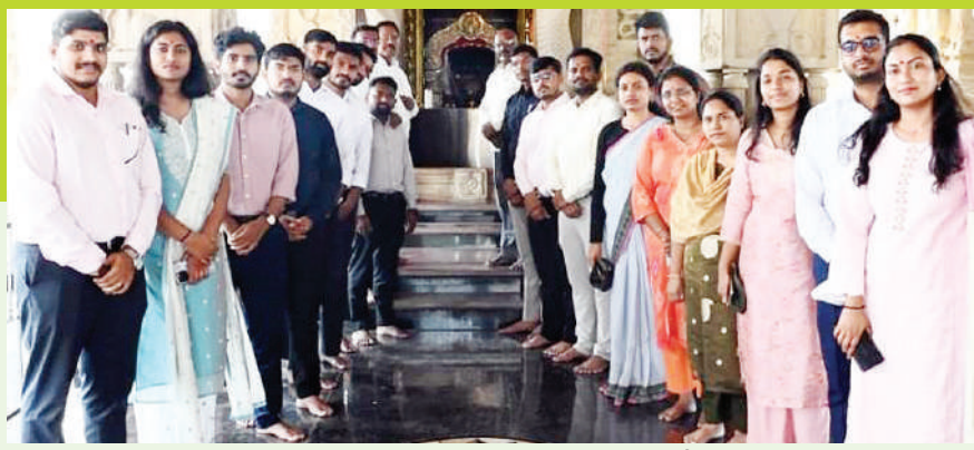
నాగోబాను దర్శించుకున్న శిక్షణ డిప్యూటీ కలెక్టర్ల బృందం