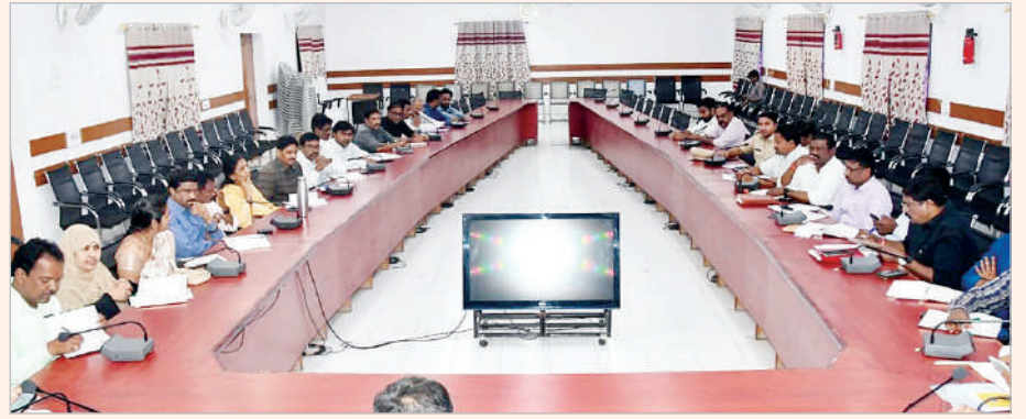
ఈ కుటుంబం, తహశీల్దార్లు, ఇతర అధికారులు, సిబ్బంది, తదితరులు పాల్గొన్నారు.