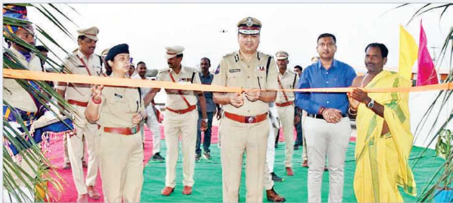
ఆదిలాబాద్, ఏప్రిల్ 7 (ప్రభాత సమాచారం)