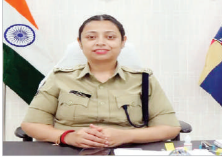
సేకరించడంతో పాటు నిందితులను త్వరగా పట్టుకునే

జిల్లాలో ప్రజలకు వేగవంతంగా, పారదర్శకంగా పోలీస్ సేవలను అందించేందుకు Onsite డోర్ ఎఫ్ఐఆర్ విధానాన్ని అమలు చేస్తున్నామని జిల్లా ఎస్పీ నితికా పంత్ అన్నారు. హత్యాయత్నం, అత్యాచార యత్నం, డోపిడీ, చోరీ, మహిళలు-చిన్నారుల పై నేరాలు, తీవ్రమైన రోడ్డు ప్రమాదాలు, పోక్సే కేసులు, ఎస్సీ/ఎస్టీ కేసులు, బాల్యవివాహాలతో పాటు ర్యాగింగ్ వంటి ఘటనల్లో పోలీస్ స్టేషన్ వెళ్లకండా..! బాధితులు ఉన్న ప్రదేశానికే వెళ్లి పోలీసు, అధికారులు ఎఫ్ఐఆర్ నమోదు చేస్తారని చెప్పారు. సంఘటన స్థలంలోనే కేసు నమోదు చేయడం వల్ల ఆధారాలు వేగంగా