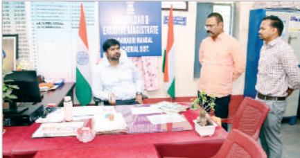
విద్యార్థుల ఆరోగ్యం పట్ల