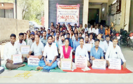
వేతన సవరణ ప్రకటించాలని కోరారు. ఈ కార్యక్రమంలో జిల్లాలోని వివిధ మండలాల నుంచి సుమారు 150 మంది విద్యుత్ కార్మికులు పాల్గొన్నారు.