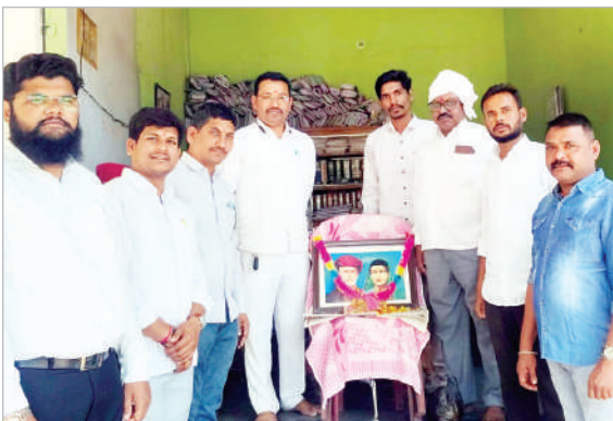
బార్ అసోసియేషన్ ఆధ్వర్యంలో