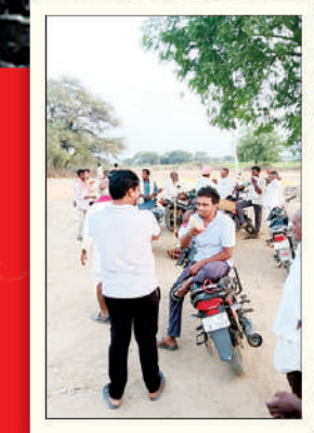
అమ్మే గ్రామంలో కల్లాల వద్దే రైతులతో 'మక్క' దళారుల బేరాసారాలు