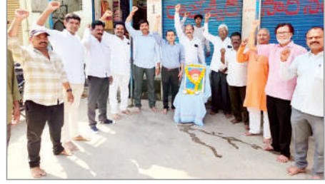
బిరుదును పూలేకు ఇవ్వడం జరిగింది. చదువు ద్వారానే అందరి భవిష్యత్తు బాగా పడుతుందని ఎలుగెత్తి చెప్పిన గొప్ప వ్యక్తి పూలే అని ఆయన అన్నారు. పూలే రచించిన