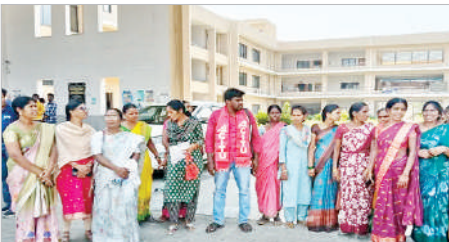
కార్యక్రమానికి మహిళా సంఘాల సభ్యులు సంఘీభావం తెలిపారు.