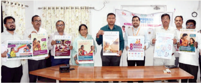
ఆదిలాబాద్, ఏప్రిల్ 13 (ప్రభాత సమాచారం)